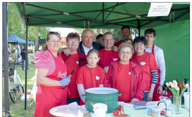
Civil majálison a Budafáért Hagyományőrző és Kulturális Egyesület csapata.