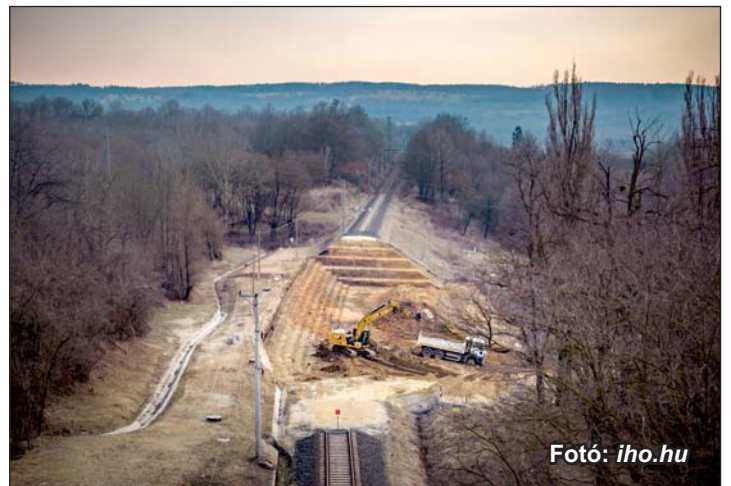
Munka a Szentgál és Városlőd-Kislőd vasútvonalon.

Ugyancsak a vasúttal kapcsolatos hír, hogy június elején végre újraindul a Zalaegerszeg és Budapest közötti személyvonat forgalom is. A 20-as vasútvonal Szentgál és Városlőd-Kislőd közötti szakaszán folyamatban van a vasúti pálya