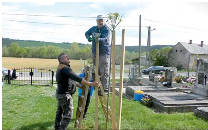
A lakosság és az önkormányzat közösen ültette a fákat a zalapatacai temetőben.

Megtárgyalta a Zalalövői Városi Önkéntes Tűzoltó Egyesület támogatási kérelmét. Az egyesület gépjárműparkjának megújítását tervezi, két 30 év körüli autót beszerzésével, mivel a jelenleg használt tűzoltó gépjárművek jelentős életkorúak, fenntartásuk és javításuk egyre nagyobb költséget jelent. A kérelmezett támogatás előfinanszírozási segítséget jelentene, amelyet az egyesület a régi