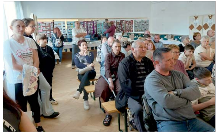
A kultúrház adott otthont az ünnepi programoknak.

A délután folyamán a kultúrház adott otthont az ünnepi programoknak, ahol már kora óráktól nagy érdeklődés mellett voltak látogathatók a kiállítások. Külön figyelmet érdemelt az „ASzakkör” zalaszentgyörgyi résztvevőinek munkáiból rendezett záró kiállítás, ahol a helyi alkotók kézzel készült, igényes tárgyai mutatták be a hagyományörzés és az alkotómunka szépségét.