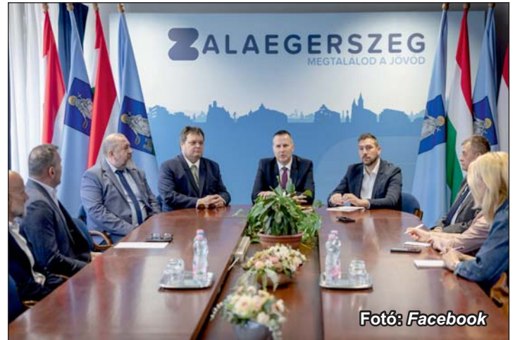
Sajtótájékoztatót jelentették be a jó hírt.

Az új vasúti deltavágány megépítésére vonatkozó nyílt, Európai Unió közbeszerzés decemberben zárult le. A legkedvezőbb ajánlatot a V-S Zala Konzorcium adta (a konzorcium tagjai a Swietelsky Vasúttechnika Kft. és a V-Híd Network Kft.). A kivitelezésre vonatkozó, 11,79 milliárd forint értékű vállalkozási szerződést 2026. február 2-án írták alá, a forrás biztosítása után pedig most lépett hatályba, így áprilisban megtörténik a munkaterület átadása és elindul az előkészítés, majd a 2028-ig tartó munka.