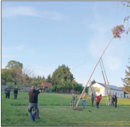
Májusfa állítása Hagyárosböröndön.

A májusfa egészen a hónap végéig, a kitáncolásig díszíti majd a települést. Bár ez a népszokás hosszú múltra tekint vissza, napjainkban is fontos közösségformáló szerepet tölt