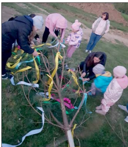
A hagyományok fontos szerepet töltenek be a helyiek számára.

A májusfaállítás előkészületei már a kora esti órákban megkezdődtek. A résztvevők közösen dolgoztak a fa