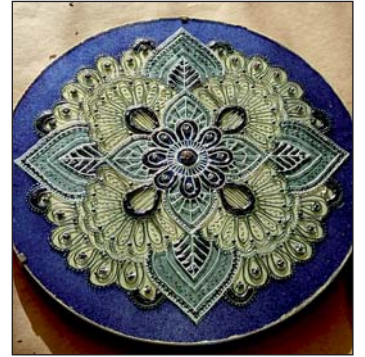
Egy elkészült mandala.

A foglalkozás központi témája a tavasz és a megújuló energia volt, amelyet minden résztvevő saját lelkiállapotának és hangulatának megfelelő színekkel jeleníthetett meg. Az alkotás nyugodt, szelíd légköre lehetőséget adott a belső világ kifejezésére, miközben támogató közösségi és oktatói környezet vette körül a jelenlévőket. Ennek köszönhetően különösebb festői előképzettség nélkül is csodálatos, egyedi alkotások születtek – mindössze nyitottságra és alkotási kedvre volt szükség.