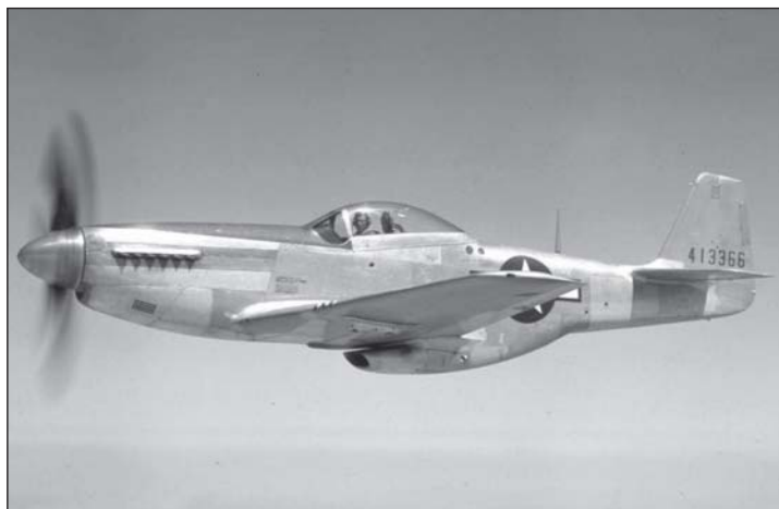
Egy P-51Mustang kísérő vadászrepülő korabeli fotója.

Március közepén a Magyar Nemzeti Múzeum Nemzeti Régészeti Intézetének hadi roncskutató szakemberei érkeztek Bagodba.