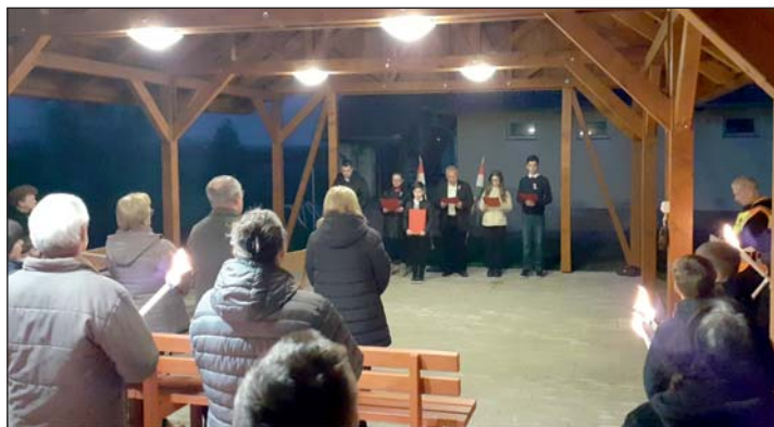
Méltó módon emlékeztek a hősökre.

A felvonulás a Községi Háznál ért véget, ahol az ideai műsor Vasvári Pál naplóberegységeit felidézve mutatta be a forradalom történetét. Természetesen a Nemzeti dal és a 12 pont sem maradhatott el, amelyek a március 15-i események meghatározó jelképei. Ezúton is köszönet illeti a szereplőket, akik közreműködésükkel hozzájárultak ahhoz, hogy a jelenlévők méltó módon adózhattak az 1848-as hősök emléke előtt.