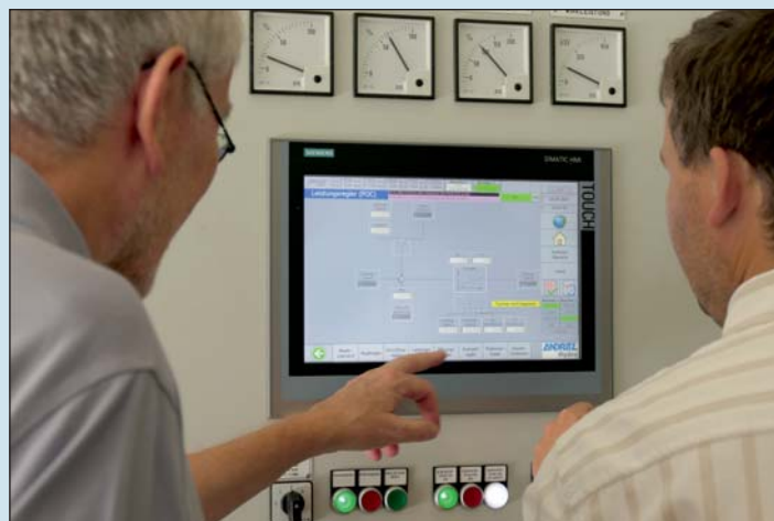
Projektpartnerek ismerkednek a vízierőmű működésével.

A 2,5 éves pályázati együttműködés egyik legfontosabb