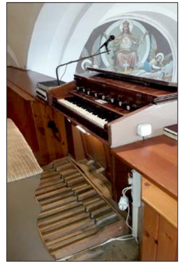
Sikeres pályázat az orgona felújítására.