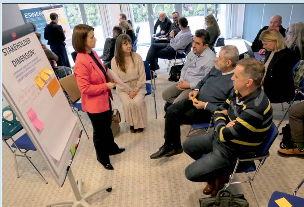
Partnertalálkozó Zala vármegyében.

Az elektromos hálózat egyik kihívása napjainkban az úgynevezett csúcsterhelés. Ilyenkor a hálózat terhelése jelentősen megnő, ami növeli az ellátási kockázatot. A pro-