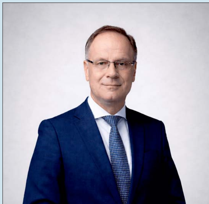
Dr. Navracsics Tibor

A VJP ugyanis egy olyan új területfejlesztés kezdeményezés, amely a szokásos, településalapú fejlesztésekkel szemben a térségi együttműködéseket ösztönzi, hiszen az egyes járások több település összefogásával pályázhatnak. A VJP keretében minden járás garantált éves fejlesztési forráshoz jut a helyi gazdasági növekedés és az életminőség javításának érdekében. A 65 milliárd forinttal rendelkező program a Területfejlesztési Alapból biztosít támogatást, induláskor legalább 250 millió forintos támogatási keretet kapnak azok a járások,