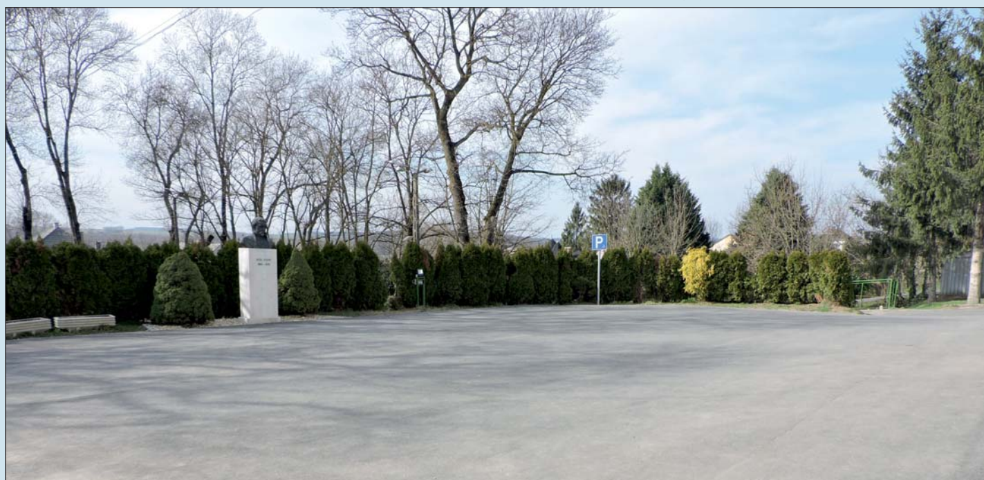
Elkerülhetetlen volt a felújítás.