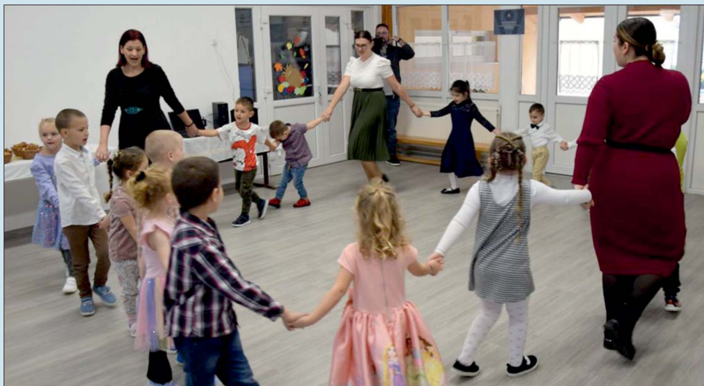
A falvak összefogtak, így megújult óvodába járhatnak a gyermekek.