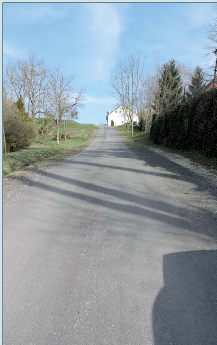
A feljáróút szintén megújult.

Az általános iskola északi oldala mellett közvetlenül húzódó feljáróút szintén töredezett, balesetveszélyes volt. Összesen 198 négyzetméter felület kapott új aszfaltburkolatot. Megfelelő karbantartás mellett hosszú élettartamú, különösen alacsony forgalmú utakon. Az építési költségek alacsonyabbak más burkolatokhoz képest. A javítása is könnyebben és gyorsabban kivitelezhető.