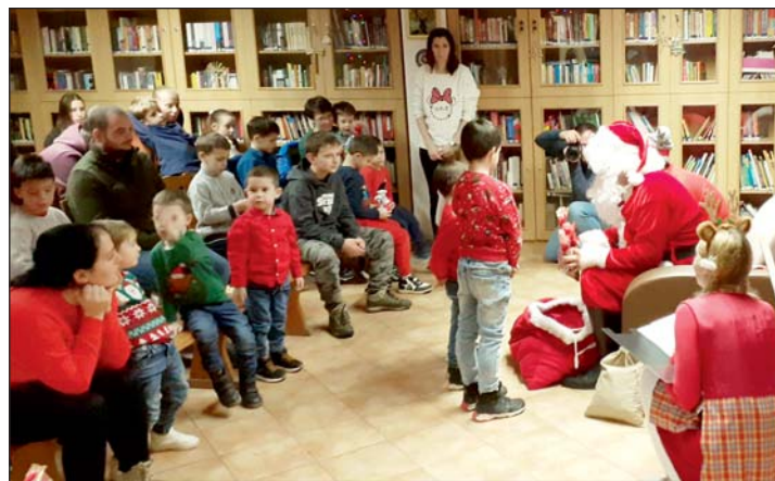
A műsor fénypontja a Mikulás érkezése volt.

Volt, aki bátran verssel készült, mások rajzzal lepte meg, egy kisgyerek pedig odaadta a cumiját, jelezve, hogy már nincs rá szüksége. Akadtak olyanok is, akik inkább félénken figyelték az eseményeket. A Mikulás senkiről sem feledkezett meg: minden kisgyerek ajándécsomaggal térhetett haza. A könyvtárban felcsendülő ének és vidám nevetés jelezte, hogy a karácsonyi készülődés már december elején elkezdődött Káváson.