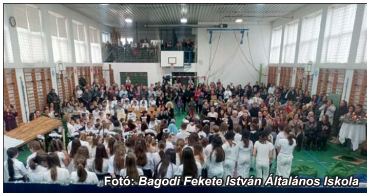
Bagodi Fekete István Általános Iskola karácsonyi ünnepe – 2025 decemberében. Tele a tornaterem...

Ezúton szeretnénk megköszönni minden közreműködő, résztvevő odaadó lelkesedését, nem egyszer fáradtsággal teli munkáját – legyen az idegeskedés-szervezés, pakolás-gyakorlás vagy díszítés-ölelés – amivel hozzájárul ahhoz, hogy közösségünk meghittan vára-