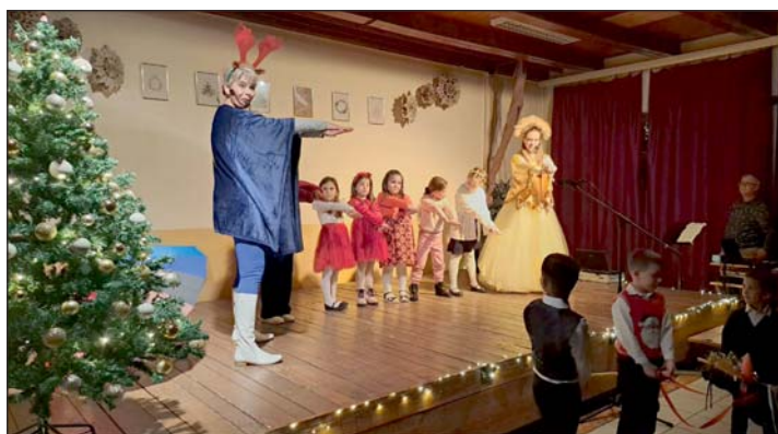
A Mini Wolf előadása.

Az adventi délután nemcsak a szórakozásról szólt, hanem az összefogásról és az egymásra figyelésről is. A jótekonysági vásár bevétele hozzájárult egy jó ügy támogatásához, így minden résztvevő egy kicsit maga