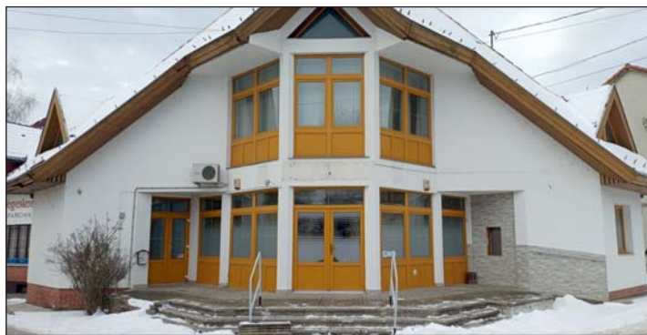
Az egykori bank épülete az önkormányzat tulajdonába került.

Az Önkormányzat támogatási kérelmet nyújtott be a