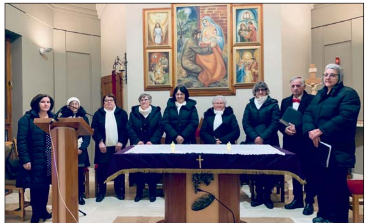
Az Esthajnal Kórus műsora.

remüködésével valósult meg egy hangverseny, mely méltó módon segítette a lakosság karácsonyra történő ráhangolódását.