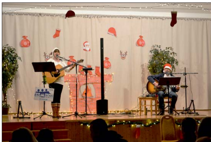
A KisKocsi Zenekar Mikulásváró koncertje.