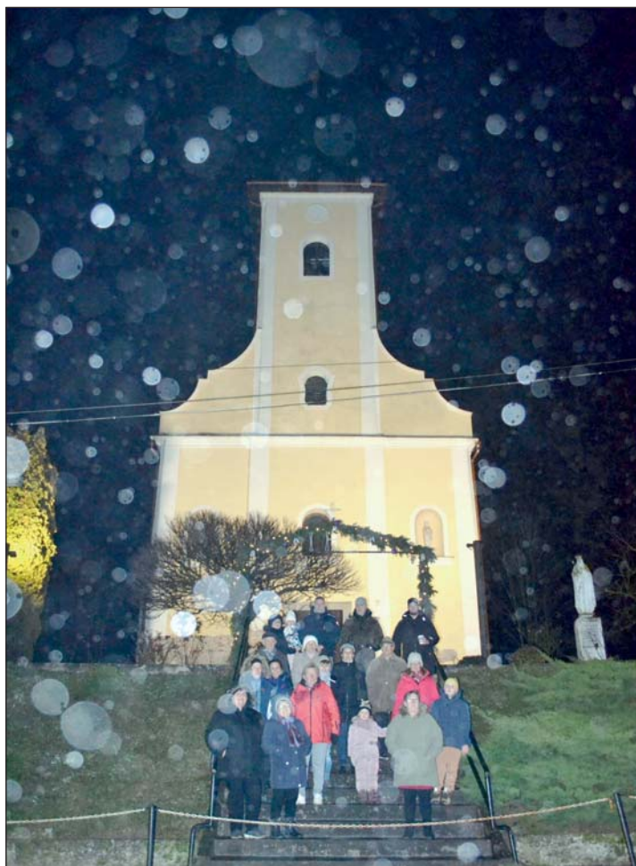
Az óvodások vidám összeállítással készültek a Falukarácsonyra.