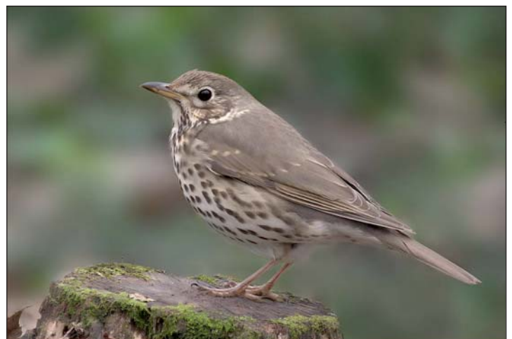
Az énekes rigó.

a figyelmet, milyen környezeti problémák fenyegetik az adott fajt.