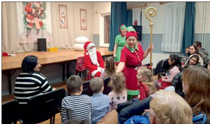
Mintegy hetvenen vettek részt a rendezvényen.

Jó volt látni, ahogy fiatal szülők elhozták kisbabájukat életében először, hogy találkozzon Petrikeresztúron a Mikulással.