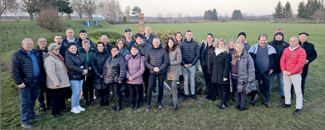
Csoportkép az új emlékoszlopnál.

Zalaháshágy 2024 szeptemberében az előző képviselő-testület által gondosan előkészített testvértelépülési megállapodást kötött az erdélyi Kovászna megyei Harallyal, mely közigazgatásilag Gelencéhez tartozik. A megállapodás aláírása óta egy alkalommal tettünk eleget a tiszteletteljes meghívásnak Gelencén egy nyolcfős delegációval, a március 15-is megemlékezéseken.