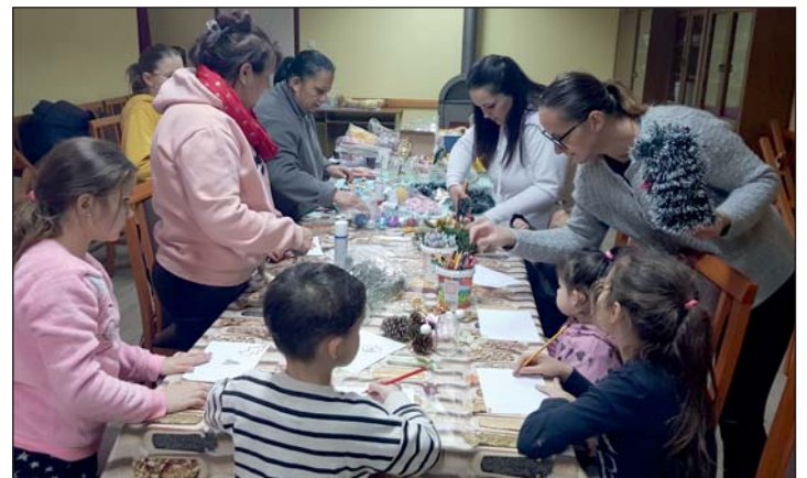
Közös alkotásra gyűltek össze.