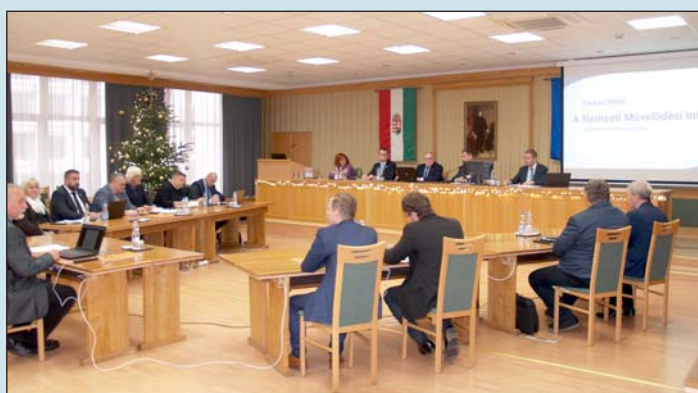
Tíz napirendi pontot tárgyaltak.

A rendeletmódosítások után a közgyűlés az önkormányzat időről-időre felülvizsgálendő közép- és hosszútávú vagyongazdálkodási tervét fogadta el, majd a vármegye önkormányzata által benyújtott pályázatok jóváhagyásáról döntött. A Társadalmi Esélyteremtési Fő-