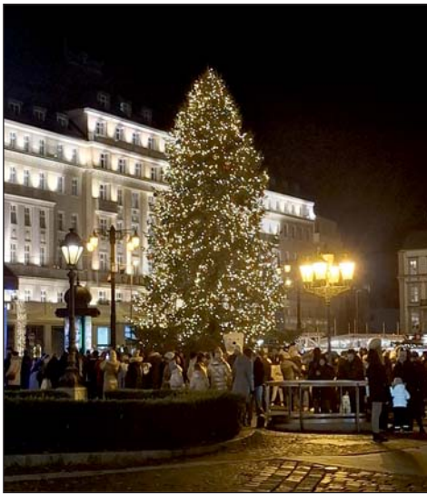
Tartalmas út volt.

A kirándulás második állomása Pozsony volt, ahol a csoport a Duna-parti főváros adventi forgatagába is beleszólhatott. A városnézés során megtekintették a hangulatos óvárost a Mihály-kapuval és a Prímási palotával együtt. Pozsony nevezetességei egyszerre idézik a középkor hangulatát és