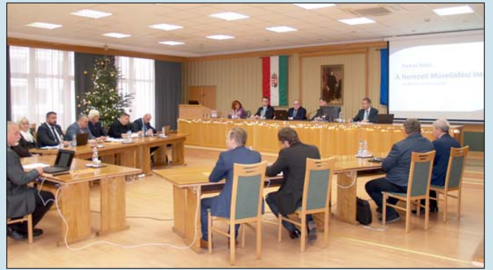
Tíz napirendi pontot tárgyaltak.

A rendeletmódosítások után a közgyűlés az önkormányzat időről-időre felülvizsgálendő közép- és hosszútávú vagyongazdálkodási tervét fogadta el, majd a vármegye önkormányzata által benyújtott pályázatok jóváhagyásáról döntött. A Társadalmi Esélyteremtési Fő-