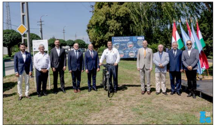
A sajtótájékoztató résztvevői.