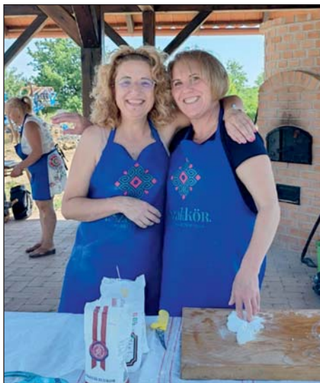
A kemencés tér háziasszonyai.

A nap másik fontos gasztronómiai eseménye volt a főzőverseny, melyre sok csapat nevezett. Feladatuk az volt, hogy olyan bográcsos ételt készítsenek, melyben bab is van. A résztvevők éltek a szabad választás lehetőségével, így a