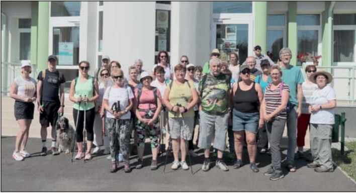
A fotón a Dombérozó gyalogtúra résztvevői.

A Göcseji Dombérozó idén kilencedik alkalommal várta az érdeklődőket a különböző rendezvényekre 33 településen közel 100 eseményen. Idén Zalalövő is csatlakozott a programokhoz. A Berkenyés Kuckó és vendégház „Régi paraszti tárgyak” című kiállításával várta a látogatókat a rendezvény ideje alatt, valamint falusi vendégtállal. Az önkormányzat a „Zalalövő 100 éve - Zalalövő város 25 éve” fotókiállításra, valamint a Dombérozó gyalogtúrára várta az érdeklődőket.