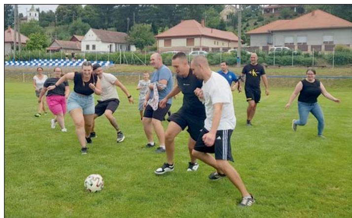
A „Nők a férfiak ellen” focimeccs tartogatott izgalmakat.

A falunapi megnyitón a közösség összetartozását hangsú-