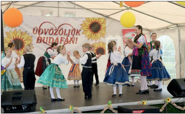
A Kislile Néptáncsoport a színpadon.