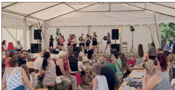
A Bagodi Fekete István iskola tanulóinak bemutatója.