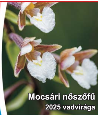
Mocsári nőszőfű 2025 vadvirága