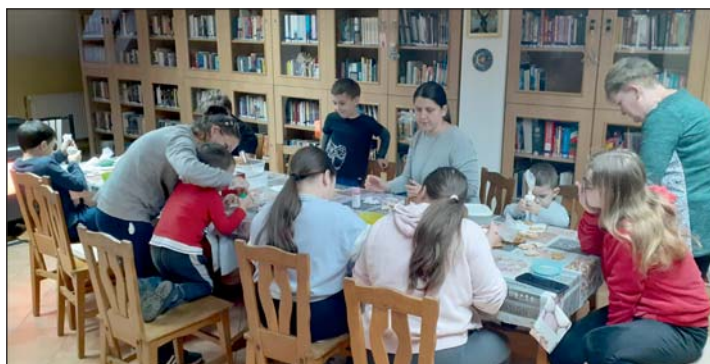
Készülnek a mézeskalácsok

A nap végén mindenki büszkén vihette haza saját készítésű mézeskalácsát, amelyet biztosan sok szeretettel fogyasztanak el majd az ünnepi asztalnál.