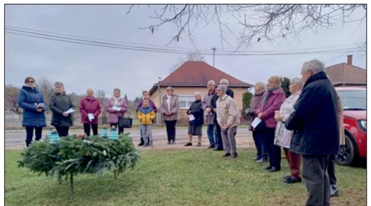
Ünnepi hangulat az adventi koszorúnál.