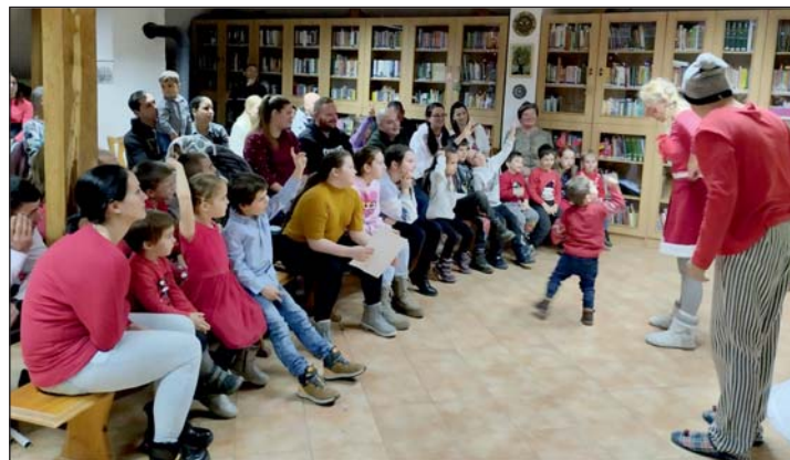
A Mikulás-várás örömteli pillanatai.