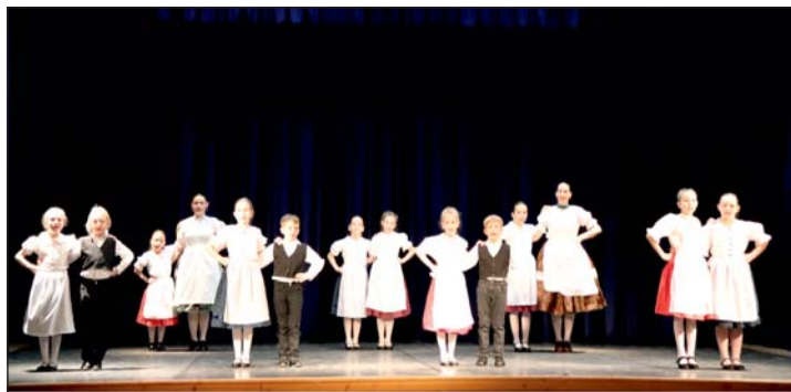
A képen a zalalövői Kislile Néptáncsoport.