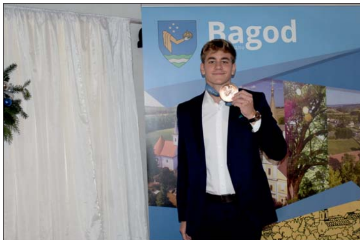
Amikor egy kép többet mond minden szónál: bagodi közönségtalálkozó Betlehem Dávid olimpiai bronzérmes úszóval, a település díszpolgárával.

Közlekedési balesetet szenvedett és megsérült?