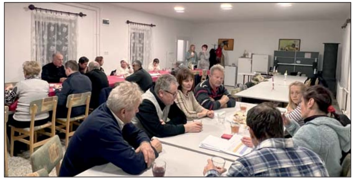
Adventi beszélgetés Hagyárosböröndön.