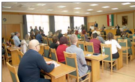
Az első konferencia.