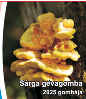
Sárga gévagomba 2025 gombája