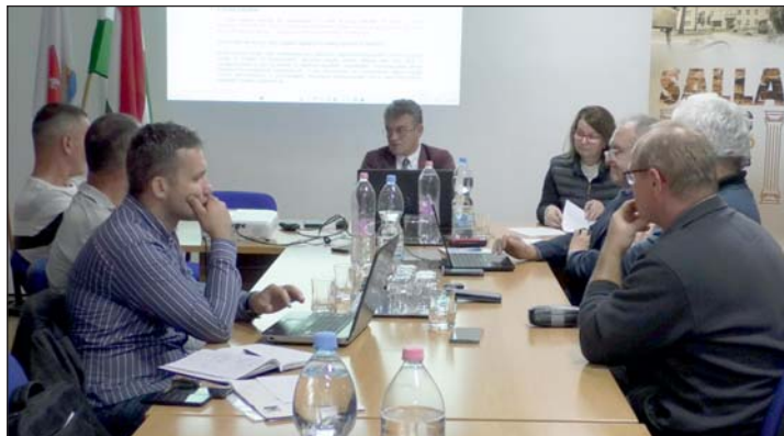
Ülésezik a testület.

Zalalövő Város Önkormányzata a Belügyminiszté-