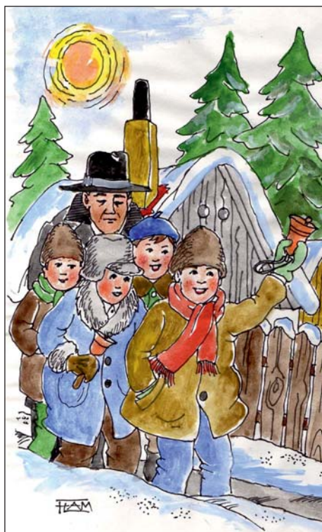
A szerző rajza

Mindannyian átéltük már az évről évre bekövetkező misztériumot, a több mint 2000 éve volt születés titokzatossága az évek sokasodásának dacára, újra meg újra megindítja szívünket. A betlehemi éj két évezrede minden esztendőben varázslatot űz lelkeinkkel; a Kisjézus születik meg bennünk, minden év lelket dermesztő hosszú várakozása után karácsony bűvöletes éjjelén.