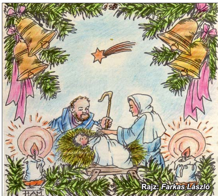
Rajz: Farkas László

Több, mint kétezer éve már, hogy a megváltás misztériuma minden karácsonyon beköltö-