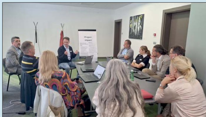
A projekt a közösségek erejét is felhasználja.

A csúcsterhelés – az az időszak, amikor a hálózatok a legnagyobb igénybevételnek vannak kitéve – jelentős kihívást jelent az elektromos hálózatok számára. A növekvő energiaigények és a megújuló energiaforrások termelési ingadozása miatt különösen fontos a hálózatok hatékony kezelése. A projekt egyik kiemelt célja, hogy olyan megoldásokat dolgozzon ki, amelyek segítségével a csúcsterhelés időszakában elkerülhető a hálózat túlterhelése.