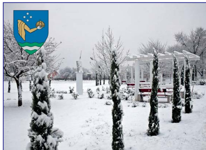
A Bagodium – Ókori római bemutató- és pihenőhely télen

Bagod Község Önkormányzatának Képviselő-testülete, valamint a Bagodi Közös Önkormányzati Hivatal dolgozói nevében a karácsony hangulatában átélt sok szép ünnepi pillanatot és sikerekben, derűs lelkületben bővelkedő új esztendő-t kívánunk ezzel a településünkön készült fotóval!