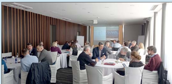
Projektalálkozó Moravske Toplicében.

Az energiaközösségek kiépítése és a csúcsterhelés hatékony kezelése hosszú távon hozzájárulhat ahhoz, hogy a helyi közösségek kevésbé legyenek függőek az energiaimporttól, és saját energiatermelésük révén gazdasági előnyökhöz jussanak.