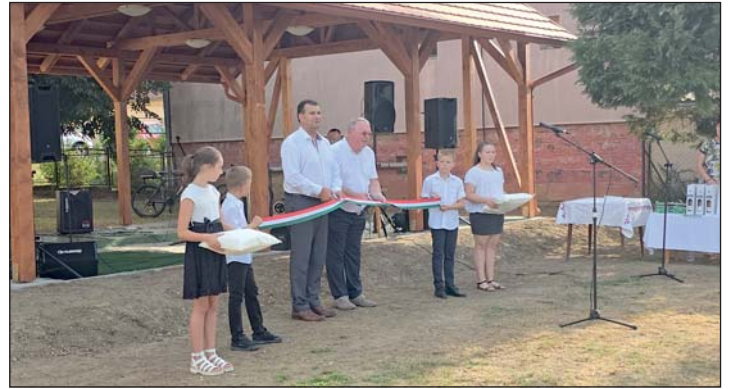
A szalagátvágás pillanata.

A helyi hagyományokhoz hűen nem maradhatott el az újszülöttek köszöntése sem. Az apróságok szülei egy kis aján-