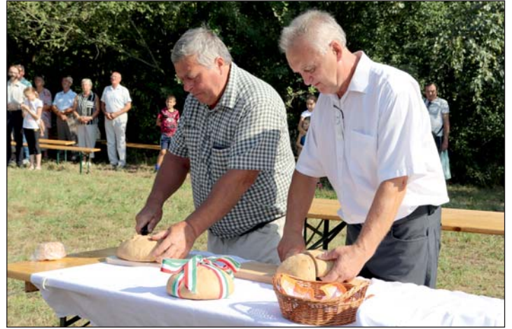
Az új búzából sült kenyer Szent István király ünnepén elmaradhatatlan.

A hagyomány szerint Szent István napján sütötték először az új búzából a kenyeret. Ma ismét sokan dagasztanak kenyértésztát természetes kovással, keresve a régi minőséget, ízelet. Nagyanyáink életében teljesen természetes volt a heti kenyérsütés, mely saját kemencékben sült ropogósra és bizony egy hétig is megőrizte minőségét.