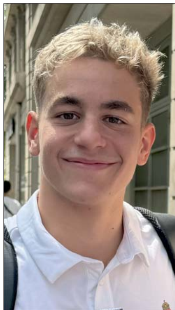
Bagod Község Önkormányzata

Azon ritka települések közé tartozunk, ahol kizárólag egyetlen címet, díjat, stb. adnak át, illetve azon néhányak egyike, ahol eddig csupán négyet adományoztak.