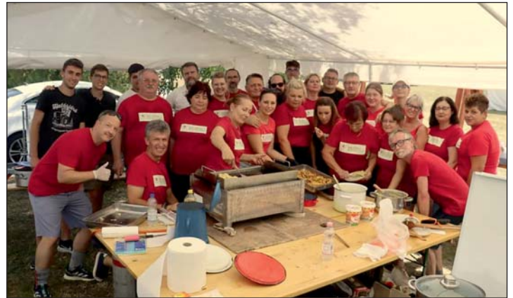
12 féle népi ételt kóstolhattott a közönség ezúttal.