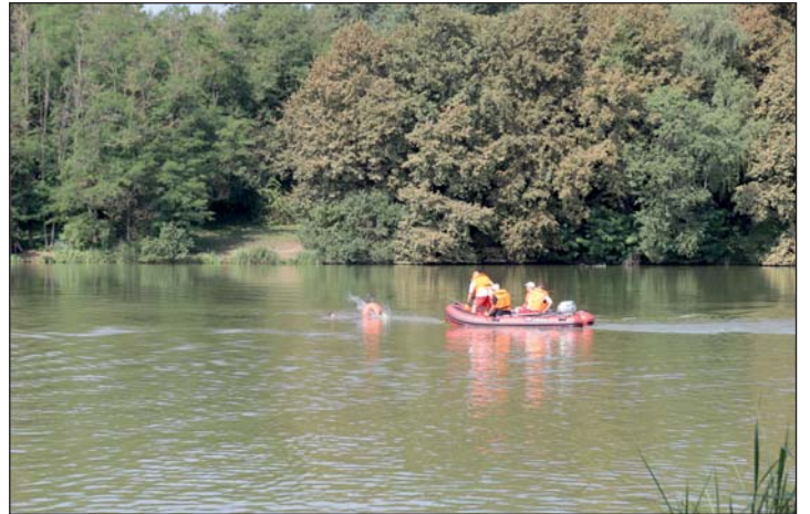
A képen a vízimentési gyakorlat.

A szombat délelőtt egy nagy összehangolt közös gyakorlat jegyében zajlott, melyen részt vettek a Körömdi Hivatásos Tűzoltóság kollégái, Né-