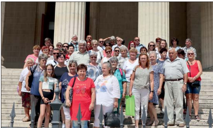
A képen a kirándulás résztvevői a Szépművészeti Múzeum lépcsőjén.