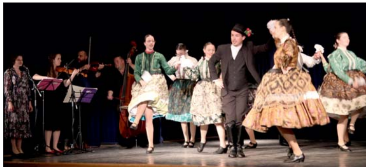
A képen az Ezüstlile Néptáncsoport.