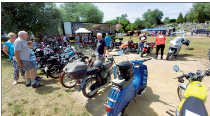
Sok régi emlék és történet is felidézésre került.