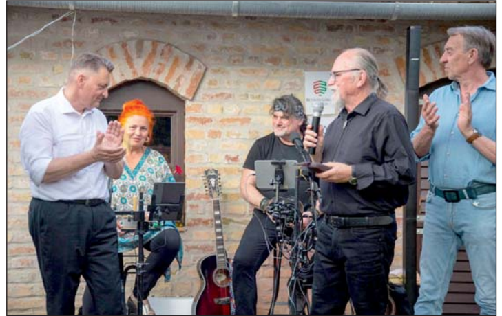
Megnyitó a Porta-Tájháznál.

Az idei művésztelep kiállítással zárult.