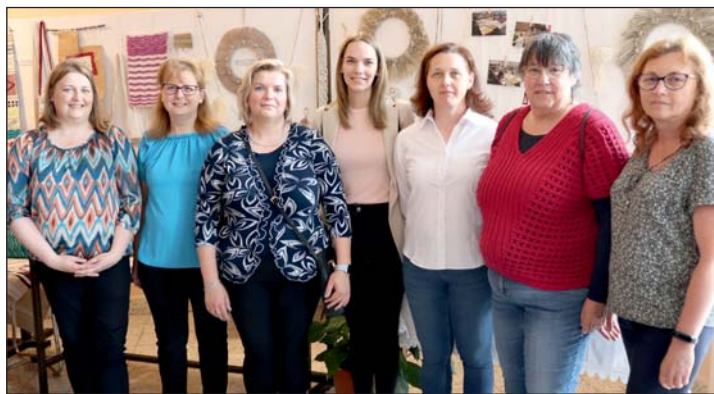
A képen a szövés kereten szakkör tagjai.