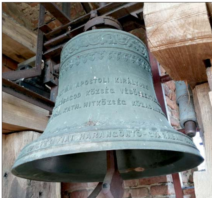
A 125 éves templom nagyharangja.