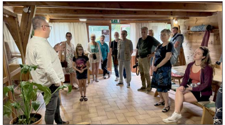
Látogatás a kézművesháznál.