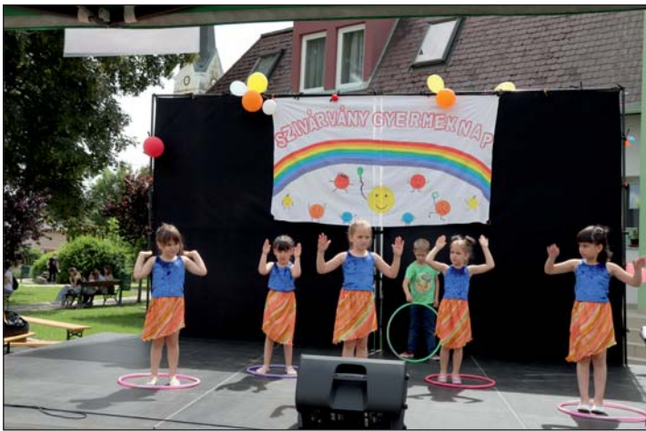
A képen a Tornyos TánClub zalalövői óvodás csoportja.

Egy héttel később a tervezetnél, de Zalalövön is megvalósulhatott a Szivárvány Gyereknep június 2-án, mely a Szivárvány Kupa labdarúgó tornával kezdődött. Több száz család kereste fel a színes, tartalmas kínálatú rendezvényt.