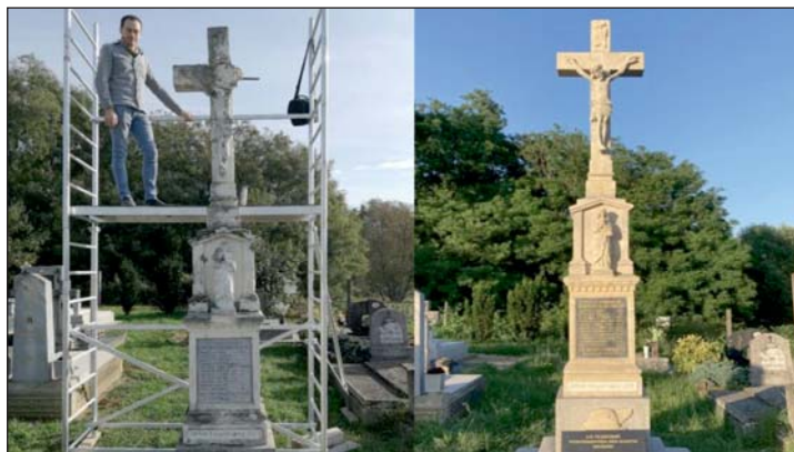
A kőkereszt az elbontást előtt és a helyreállítást követően.

Korábban hírt adtunk arról, miszerint az a megtiszteltetés ért minket, hogy együttműködhetünk a Magyar Képzőművészeti Egyetemmel.