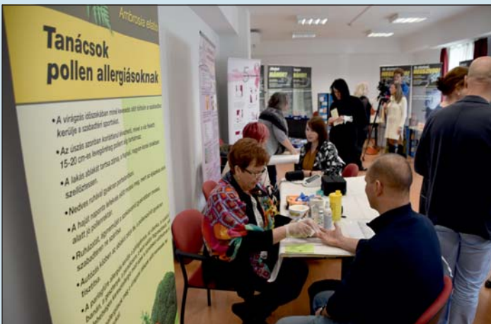
Közel 70 munkáltató csatlakozott a „Szűrésbarát munkahely” programhoz.