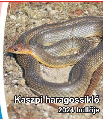
Kaspi haragossikló 2024 hüllője