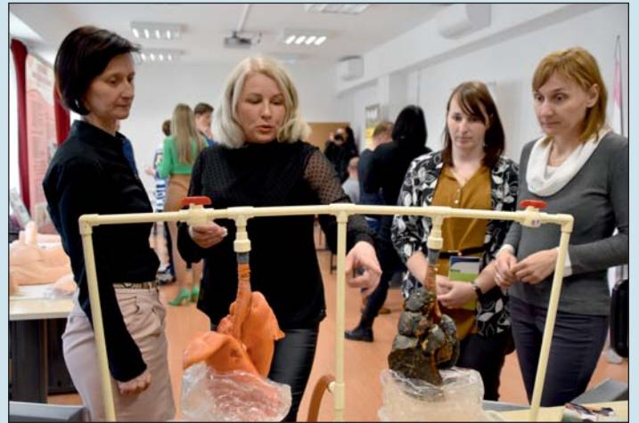
Általános állapotfelmérés, önvizsgálat oktatás, szűrések népszerűsítése zajlik.

A pollenmonitorozás, a lakosságot érintő biológiai eredetű légszennyezettségi paraméterek folyamatos monitorozása is napi szintű feladata a főosztály egészségfejlesztéssel foglalkozó szakterületének, melynek keretében pollencsapadékat működtetnek kollégáink, illetve elvégzik a mintaolvasást, az adatok rögzítését, illetve a rendelkezésre álló adatok más egészségügyi szervek és a média felé történő to-