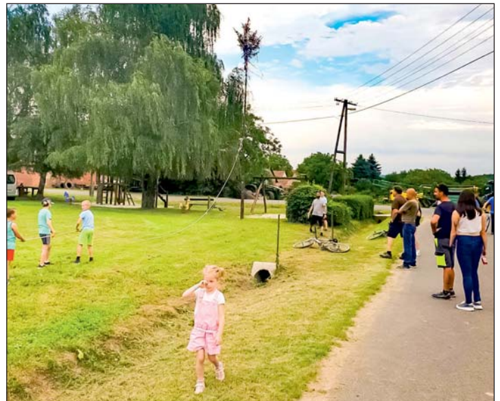
Még áll a májusfa, de...