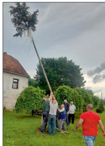
A hagyomány idén sem szakadt meg Keménfán. Zs.E.

Az este jó hangulatban, sok mókázással telt.