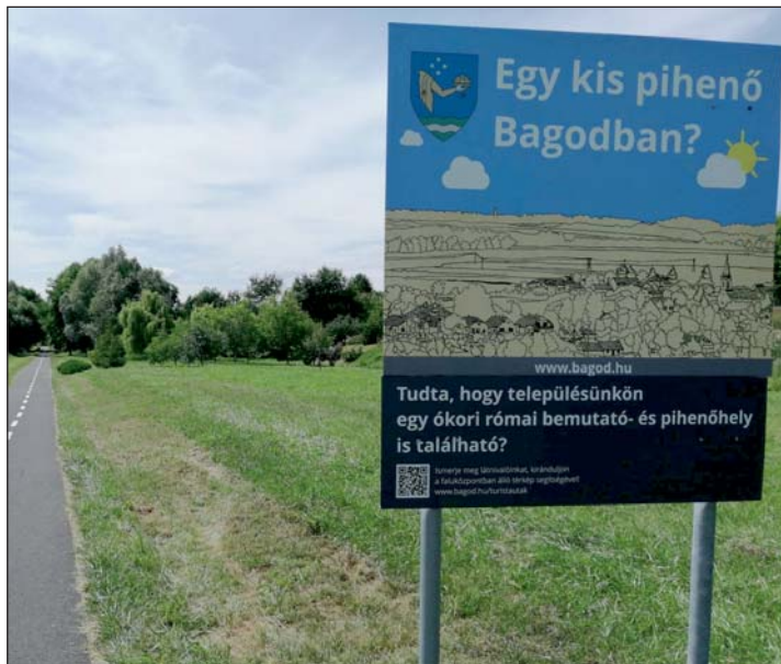
A figyelemfelkeltés egyik különleges módja Bagodban.