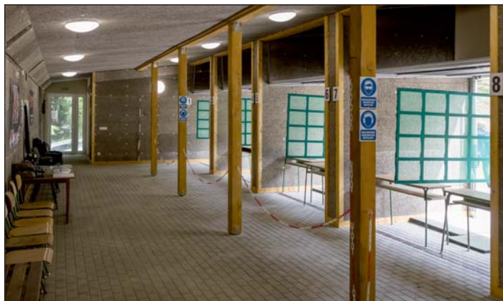
A búslakpusztai lőtér felújították.