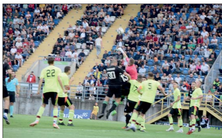
Méltó körülmények között került sor a fináléra.