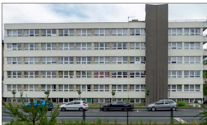
Megújult a Kamarák Háza.