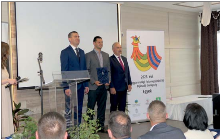
Balról Dukai Miklós államtitkár, Kungli József polgármester és Nagy István agrárminiszter.