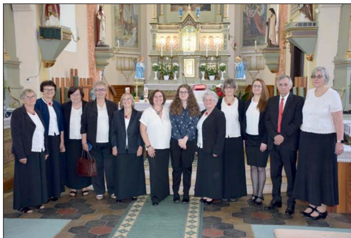
Az ünnepelt - háttérben a templom főoltára - és az ünneplők.

2024-ben először 50 vidéki magyar településnek volt lehetősége helyszíniként szolgálni. Büszkék vagyunk rá, hogy a két Zala vármegyei község közül mi lehettünk az egyik. Köszönjük a Fiharmónia Magyarország Nonprofit Kft. , to-