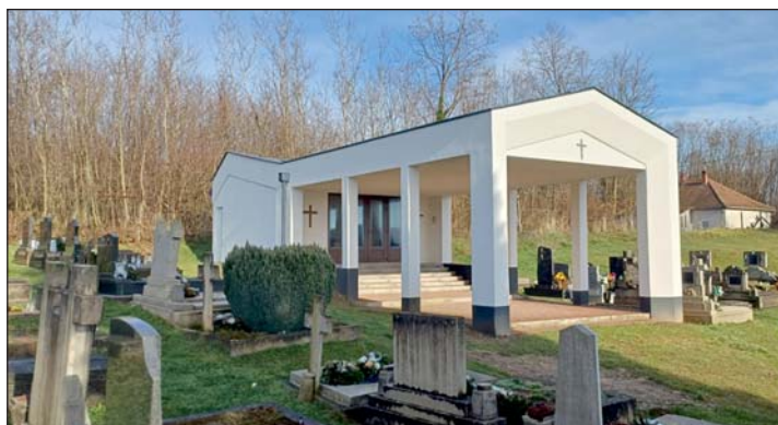
A zalapataikai temető ravatalozójának bővítése és felújítása is megvalósult.

Természetesen hiányérzetünk is van, az utak, járdák felújítása, az ivóvízhálózat rekonstrukciója, a közösségi épületek felújítása terén. További előrelépés szükséges a zöldterületek gondozása, virágosítás tekintetében. Egyelőre terv maradt, de megoldandó feladat a karbantartó részleg kiköltöztetése, ezáltal a hivatal és a gyógyszerár mögötti multifunkciós tér kialakítása parkoló, piac, rendezvényter céljaira.