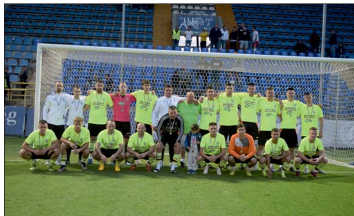
A kupadöntős zalalövőiek.