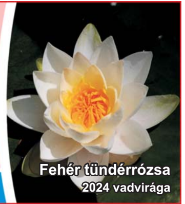
Fehér tündérrózsa 2024 vadvirága