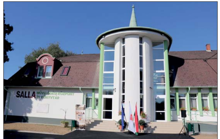
A Salla Művelődési Központ energetikai felújítása megtörtént.