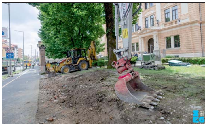
Elkezdődött a Zrínyi-gimnázium rekonstrukciójának utolsó szakasza.

Zalaegerszeg tehát nem csak saját polgáira gondol. Adottságai és dinamikus fejlődésének köszönhetően mindezeket az újszerű lehetőségeket megosztja a környező településekkel is.