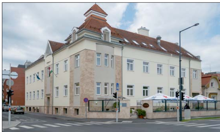
A Zala Vármegyei Kereskedelmi és Iparkamara is megszépült.