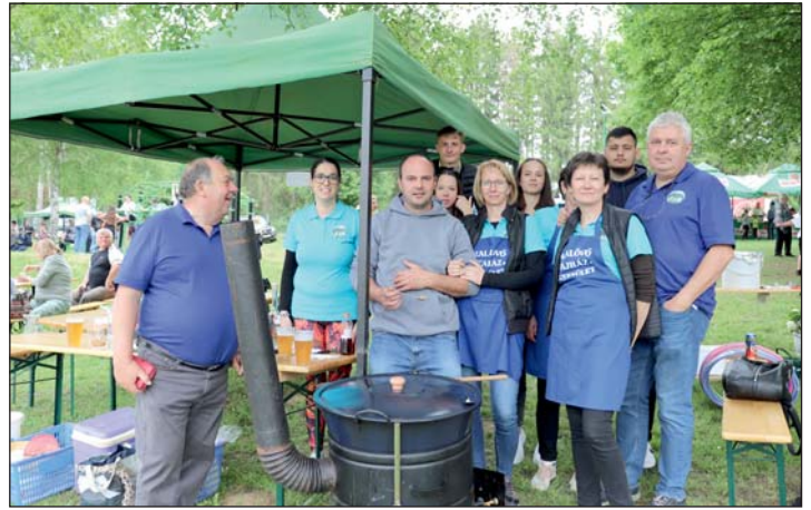
A képen a Zalalövő Tájház Egyesület főző csapata.

Kilenc főző csapat, illetve magánszemély gondoskodott arról, hogy finom ételeket kóstolhassanak, így köszönet illeti a Zalalövő és Csöde Polgárőr Egyesülete, a Budaféért Kulturális és Hagyományörző Egyesület, a Zalalövői Autó- És Motorsport Egyesület, a Zalalövő Tájház Egyesület, a Zalalövői Borbarát Kör Egyesület, a Zalalövői Városi Önkéntes Tűzoltó Egyesület, az Ezüstlile Egyesület, a Sógik és Csöde Község Önkormányzat munkáját.