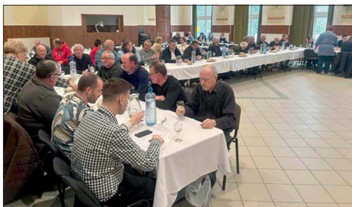
Vacsorával vendégelték meg a résztvevőket.

Ők dönthettek arról, hogy ki lesz az Aranyhordós borosgazda, a zsűri pedig kiválasztotta a térség legjobb fehér- és vörösborát. A harminchat mintából hét kapott arany, tizennyolc ezüst, hat bronzminősítést, öt pedig oklevelet. A bírálók hasznos tanácsokkal látták el a gazdákat, észrevételeik segítik a termelők munkáját, hogy még eredményesebb munkát tudjanak végezni a bor-termelés során.