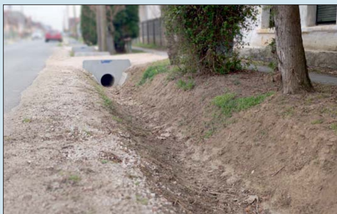
123 millió forint 100 %-os támogatást nyert el Vasboldogasszony.