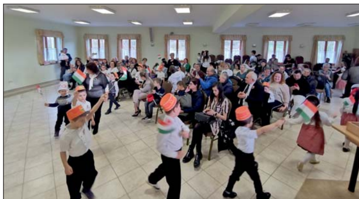
A helyi óvodások ünnepi műsora.