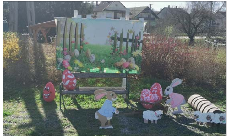
Fotópont került kialakításra.