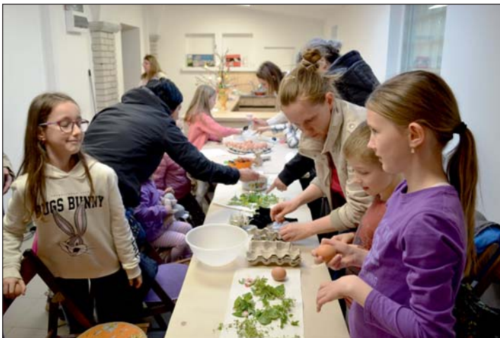
A berzseléssel is megismerkedtek a gyerekek.