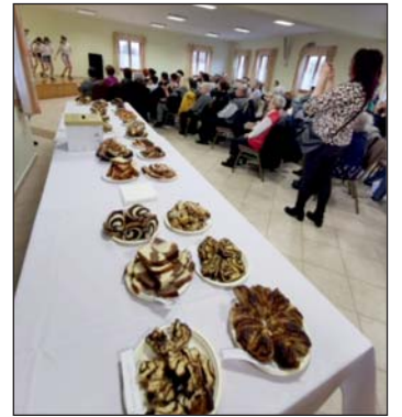
A kóstolásra kihelyezett kalácsok

finom sütemények kóstolása közben megejtett beszélgetés, a hagyományörzés élménye mindenki számára értékálló, azonnali nyereség. Cseppet sem utolsó sorban, minden jelenlévő hölgyet köszöntött Tóth Gábor, a szervezők, az önkormányzat nevében. Színpadi produkcióról a Tófeji Örökmozgó Gyerekek , a Fanatic Jump Tófej csapata illetve Bot Gábor és Debrei Zsuzsanna gondoskodtak.