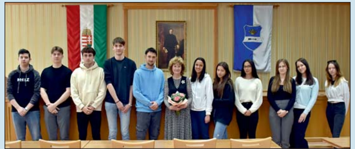
A kanizsai diákok a kormányhivatalban.