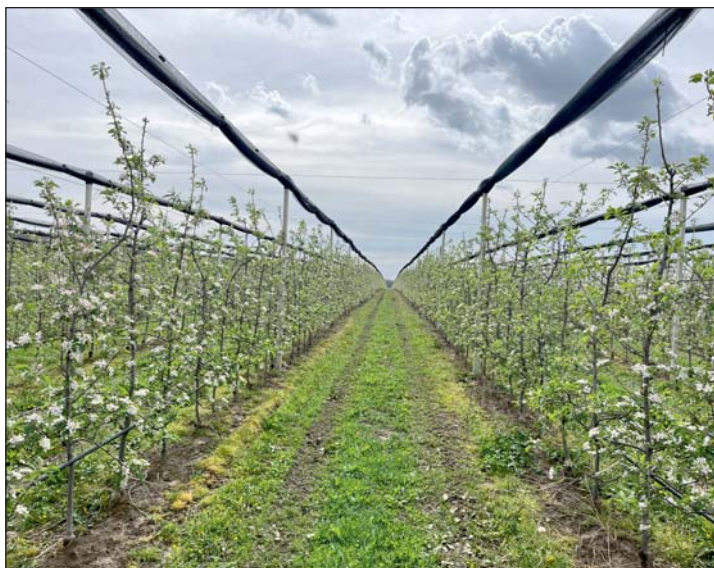
A kilimáni almáskert virágzó fáit.

Az „Ültess Fát” zöld kezdeményezés keretében gyümölcsfa ültetésre szeretnénk ösztönözni az intézmények 6. osztályos tanulóit, Úgy gondoljuk, hogy a Föld Napja is kiváló alkalom, hogy a gyermekek – legyen az óvodás, általános iskolás diák vagy középiskolás – felkeltsük a figyelmüket a környezetbarát életmódra, akár faültetéssel.