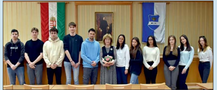
A kanizsai diákok a kormányhivatalban.