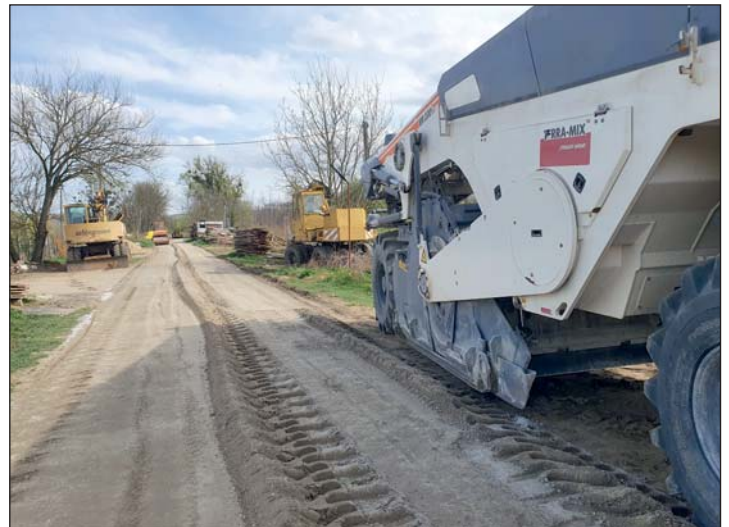
A felvétel az alapozási munkák idején készült.

Az út felújítása, aszfaltozása – az időjárástól függően – várhatóan április végéig befejeződik.