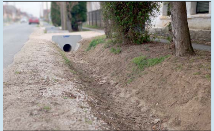
123 millió forint 100 %-os támogatást nyert el Vasboldogasszony.