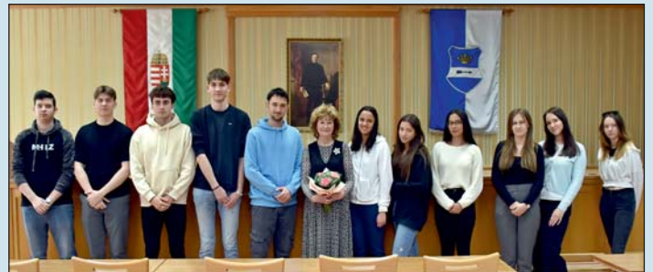
A kanizsai diákok a kormányhivatalban.