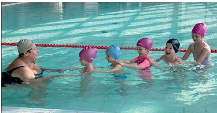
A keresztúri gyerekek már ovisként megtanulhatnak úszni az óvónőknek és a dajkáknak köszönhetően.

az izmokat fejleszti, de javítja a ritmusérzékét, a mozgáskoordinációt is. Ezért is jó, hogy a keresztúri oviban a gyermekeknek lehetőségük van az úszás elsajátítására, és ebben kiemelt szerepe van az óvónőknek és dajkáknak.