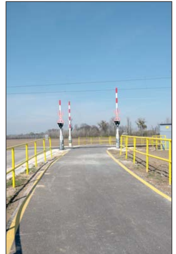
Modern, biztonságos vasúti átkelőt építettek a kerékpárútra.

A Molnári és Örtilos közötti bringaut jó lehetőséget nyújt arra, hogy minél többen megismerhessék a Mura kivételes természeti értékeit, fellendítsék a környék turizmusát.