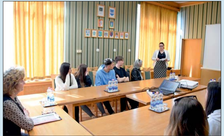
Az elhangzott tájékoztató kiemelte, hogy fontos az elméletben tanultak gyakorlati hasznosítása.

Dr. Sifter Rózsa köszöntőjében kitért arra, hogy a Zala Vármegyei Kormányhivatal kiemelten fontosnak tartja a fiatalok segítségét a számukra megfelelő pályaválasztási döntés meghozatalában, ezért az országban elsőként egy teljesen új pályaválasztási programot dolgoztak ki. A főispán ismertette a több mint tízéves múltra visszatekintő kormányhivatali rendszert, majd bemutatta a hallgatóknak a hivatal működését, akik végül kérdéseket tehettek fel a főispánnak.