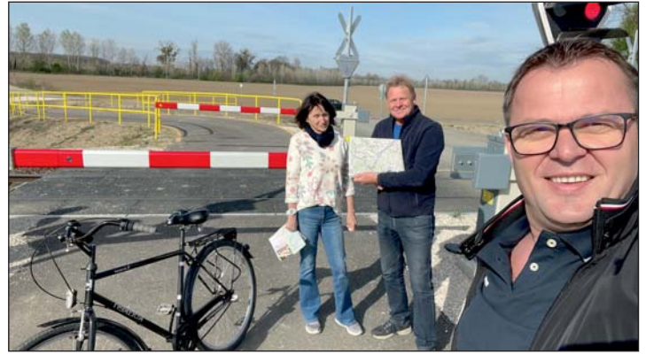
Fellendítheti a turizmust a Mura-menti bringaut.

menti bicikliúton. Nyáron egy nagyobb csoporttal térnek majd vissza, most a tervezett túraútvonalukat járták be. El voltak ragadtatva a tájtól, júliusban már két keréken térnek vissza társaikkal.