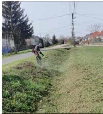
A jó idő megérkezéssel belendült a természet Murakeresztúron.

Murakeresztúr nekik is köszönhetően az egyik legtakarosabb település a vármegyénkben.