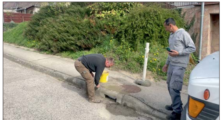
Murakeresztúron tavaszi karbantartási feladatokat végeznek az önkormányzat dolgozói.

Április elején a murakeresztúri önkormányzat karbantartói kijavították az Alkotmány út egyik csapadék-elvezető lefo-