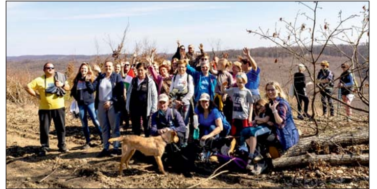
Negyedik alkalommal rendezték meg az emléktúrát.