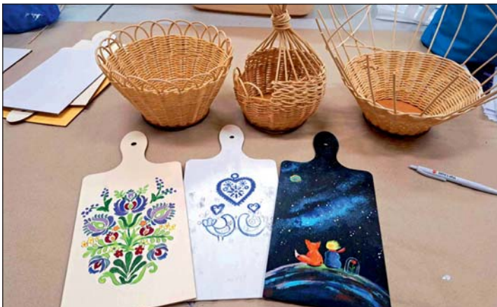
Kosárfonás és dekorációs vágódeszka.