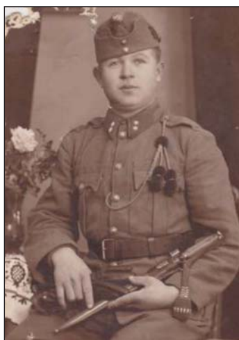
Egy szentpáli fiatalember frontra indulása előtt, 1942-ben készült fényképe. A Donkanyarban vesztette életét.

„A plébánia hívei papjaikkal együtt nagyon nehéz napokat éltek át. Sokukat a jó Isten különös kegye mentett meg a haláltól. Alsóbagod községében híveim közül négyen haltak vértanúhalált: 1 kisleánya, kit 10 éves kora ellenére becsületenitett meg egy katona, 2 asszony és egy 25 éves legény. Mindnyájan ártatlanok, kik egy szóval sem bántották meg a tettest... Az egyházi épületekben nem esett nagyobb kár; mindössze a plébániatemplom 12 ablakablajára tört be a közeli vasúti híd robbantása alkalmából. A templomokat nem gyalázták meg,