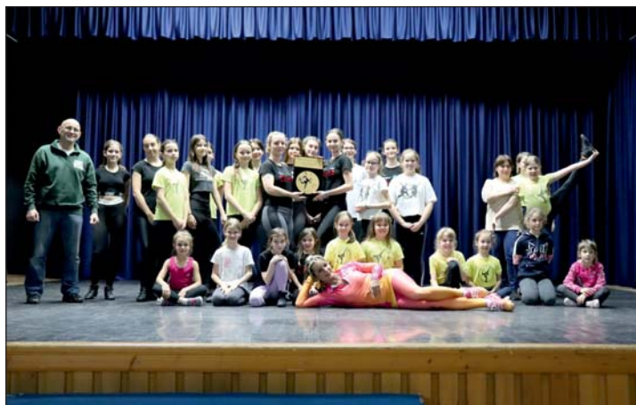
A Galaxy Akrobatikus Rock and Roll Egyesület zalalövői csoportja és a Fővárosi Nagycirkusz artistái.

Hamarosan Zalalövőn is nagyszabású megmérettetésre jelentkezhetnek a műfaj versenyzői: május 12-én a művelődési központ ad helyet a nyugat-magyarországi utánpótlás akrobatikus rock and roll táncversenynek.