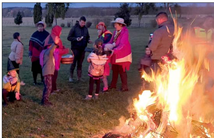
Télbúcsúztató pillanat Káváson.

Közlekedési balesetet szenvedett és megsérült?