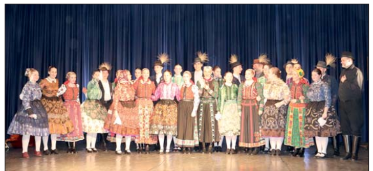
A képen a műsorban fellépők: a Magyar Állami Népi Együttes és az Ezüstlile Néptáncsoport.

TIT Öveges József Ismeretterjesztő és Szakképző Egyesület