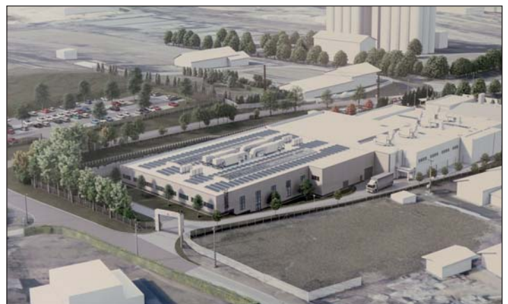
A beruházás látványterve.

Érdeklődni a zalatajkiado@gmail.com , zalataj@zelkanet.hu e-mail címen, vagy a 92/596-936-os telefonszámon lehet hétköznap 8-12 óráig.