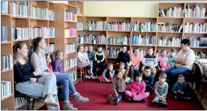
A Szivárvány csoport az interaktív órán.

A zalalövői „Salla” Művelődési Központ könyvtára évente több alkalommal tart tematikus könyvtári foglalkozásokat a helyi óvoda nagycsoportosai számára. Az idei évben 2024. február 26-án került sor az első ilyen jellegű találkozóra. A Zalalövői Borostyán Óvoda és Mini Bölcsőde