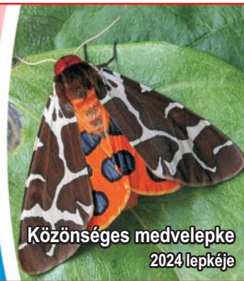
Közösséges medvelepke 2024 lepkéje