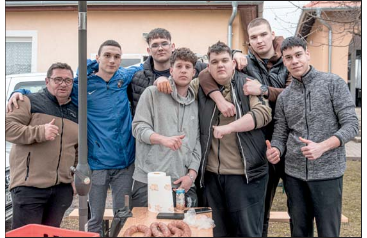
A HBZ nevű csapat a kolbásztöltő fesztiválon.

A csapatok jellemzően 4 fővel indultak, de természetesen elkísérték őket a barátok, családtagok is. 16 óra körül már finom illatok szálltak a levegőben, és sokan már büszke, elégedett mosollyal kínáltak