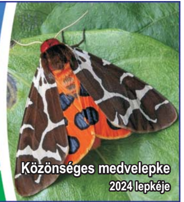
Közönséges medvelepke 2024 lepkeje