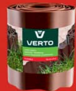
Ágyásszegély 15 cm x 9 m, 15G514