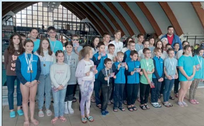
A Lenti GYÚK csapata a versenyen.

A Lenti GYÚK versenyzői közül az alábbi úszók első helyezéssel továbbjutottak az országos döntőbe: