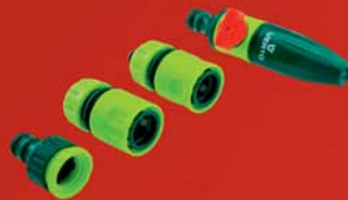
Öntöző fej szett, 15G711