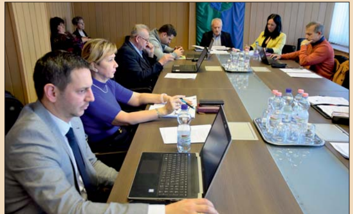
Mintegy 2,5 milliárd forint forrásra pályázik az önkormányzat a TOP Plusz programmal. Képen a képviselő-testület.

Az első fejlesztési ütemben a tervek szerint parkolót alakítanak ki az Akácfa úton a Kossuth és Bánffy utcák között, átépítik a bíróság épülete mögötti parkolót és felújítják a Polgármesteri Hivatal mögöttit, illetve az Inkubátorháznál található megállóhelyet egyebek mellett. Utfelújítás és építés lesz a Gyöngyvirág, Alkotmány, Hársfa, Ady Endre, Szövetkezeti, Atkötő, Akácfa,