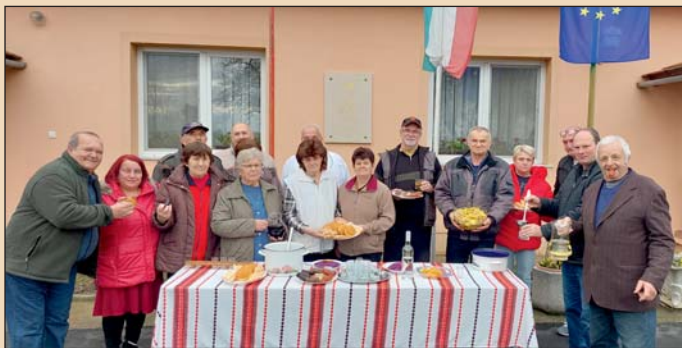
A hagyományőrzés jegyében gyűltek össze a helyiek Külsősárdon a disznótoros vacsorára.