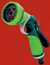
Öntöző pisztoly, 15G702