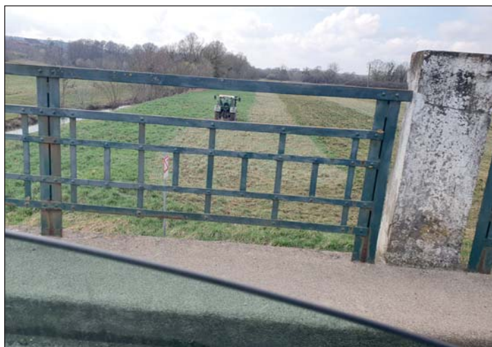
A fotó megörökítette „munka” közben a traktort.

A Zala Vármegyei Rendőr-főkapitányság sajtószóvivőjének tájékoztatása szerint a