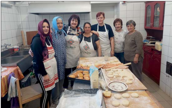
A fánksütő csapat.

A visszajelzések alapján nagyon örültek a finomságnak, ezért tervezik a kezdeményezés folytatását.