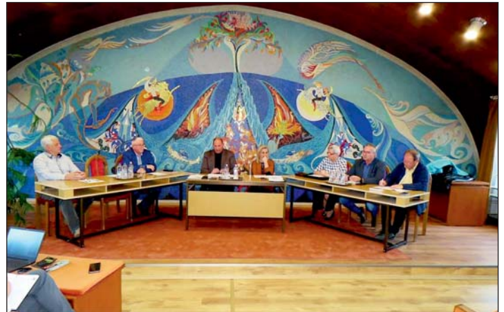
Az érdeklődés most csekély volt.

például az Eötvös utcai óvoda felé történő járda építésére, a Szent Imre herceg utca burkolatának, a közös önkormányzati hivatal épületének, a városi könyvtárnak, vagy az egyik ravatalozónak a felújítására, illetve egy traktor beszerzésére szóló igényüket – forráshiány miatt – elutasították. A polgármester úgy fogalmazott: ezek a pályázatok tartalmilag és formailag is megfeleltek a kiírásnak, vagyis nem az önkormányzat hibája, hogy nem tudták megvalósítani a tervezett programot. Nyert viszont a regionális kerékpárút fejlesztésére kiírt pályázat, amelynek lebonyolítója a vármegyei önkormányzat. Ezzel a beruházás-