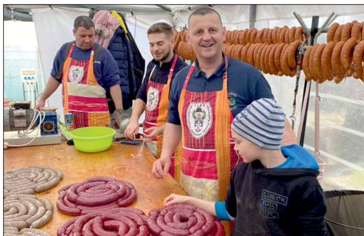
A Keresztúri Szikracsapók immár tizedszer vettek részt a Murakeresztúri Böllérfesztiválon.