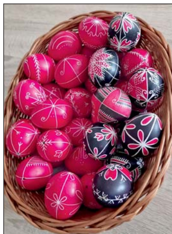
Horvát és magyar népi mintával díszített tojásokból lesz kézműves foglalkozással egybekötött kiállítás.