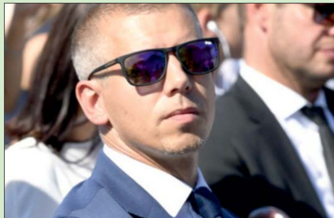
Ma is vannak (hatalom)éhes kiscigömböcök...