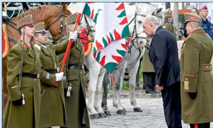
Sulyok Tamás köztársasági elnök beiktatási ünnepségén a budapesti Szent György téren 2024. március 10-én. Jobbra Boröndi Gábor vezérezredes, a Honvéd Vezérkar főnöke.

Kiemelte: köztársasági elnökként is az alaptörvény lesz munkája sarokpontja, kerete és mércéje, amely pedig pontosan megfogalmazza, hogy a köztársasági elnök kifejezi a nemzet egységét és örökdió az államszervezet demokratikus működése felett. „Ez az egység az, amit nem lehet és nem is engedek megbontani” – hangsúlyozta, hozzátéve: „ez a működési forma az, amelynek keretei között értelmezem a szolgálatom, és melynek határait következetesen fogom őrizni és nem engedem átlépni.”