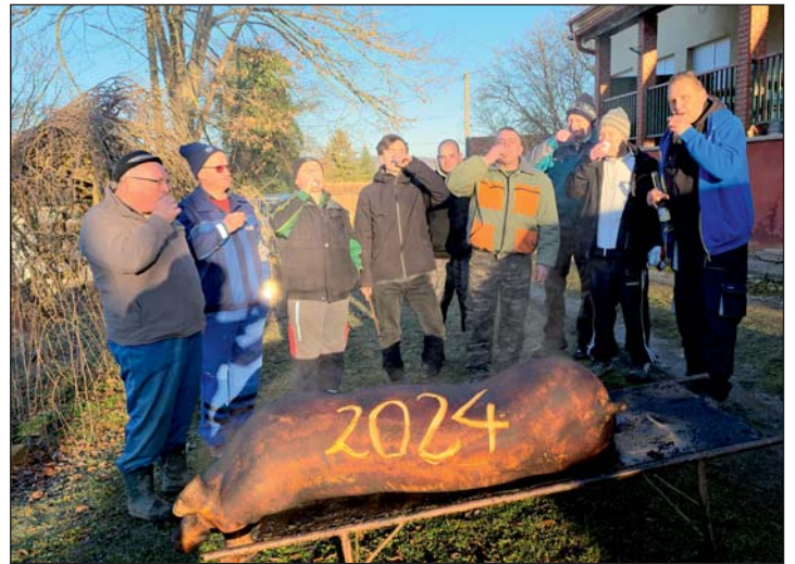
Kávási férfiak: stamperedli a kézben, hagyományok a szívben.

Egy hideg téli napon a kávási közösség összefogott, hogy együtt ünnepelje meg a hagyományos disznóvágás izgalmas és ízletes eseményét. Férfiak, nők és gyerekek egyaránt részt vettek a rendezvényen, és a falu megtelt nevetéssel, izgalommal és finom illatokkal.