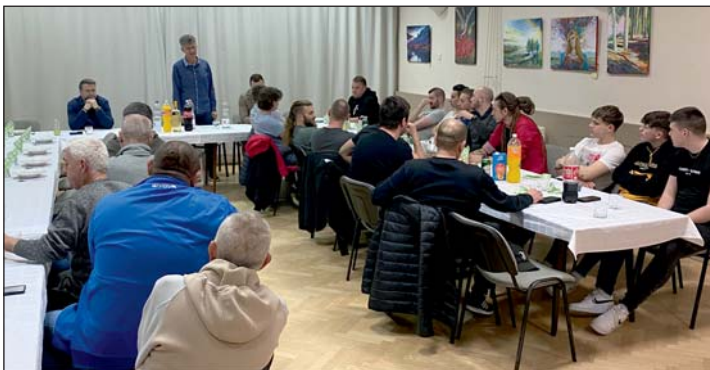
Közös vacsorával zárult az ülés.