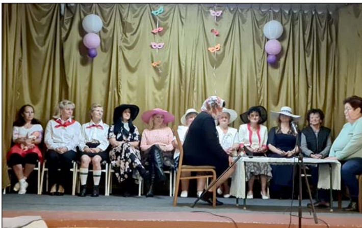
A színjátszók műsora.

2023. év elején került sor a 2022. év végén befejezett 20 millió forint értékű járda felújítási pályázat pénzügyi elszámolására.