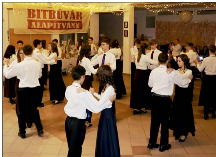
A nyolcadik osztályosok nyitották a bált.

A Bitbúvár Alapítvány kuratóriuma ezúton köszöni meg a szülőknek, pedagógusoknak, segítőknek és a támogatóknak, hogy munkájukkal segítették a program megvalósítását, előkészületeket, jelenlétükkel, felajánlásukkal támogatták a rendezvény sikerét.