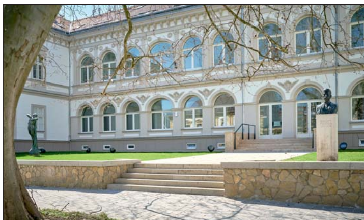
A Zalaegerszegi Múzeumok Igazgatósága impozáns főépülete.