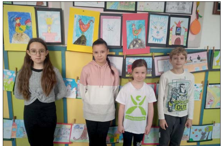
A rajzpályázat helyi díjazottjai.

Ebben az évben először – egyúttal hagyományteremtő szándékkal – színjátzó fesztiválra is sor került, melynek keretein belül a Zalaegerszegi Ady Endre Általános Iskola, Gimnázium és Alapfokú Művé-