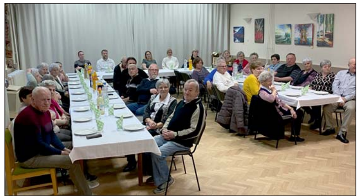
Sokan részt vettek a nyugdíjasok köszöntésén.