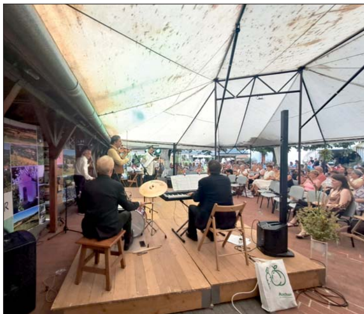
Jó estét nyár, jó estét fogadó...