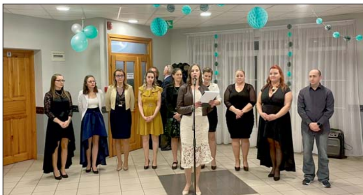
Az óvodai bált is támogatták.