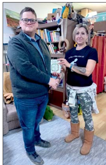
50 kg lisztet adományoztak.