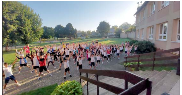
Aktív Iskola programnyitó közös bemelegítés.

Ötödik osztályosaink az alsó tagozat után a felső tagozat munkáját kezdték meg. Sabján