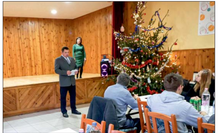
Ünnepi program volt.

A műsorban a Fürge ujjak kézimunka szakkör tagjai idősek napi és karácsonyi műsorral léptek fel, melyben versek, népdalok és könnyűzenei dalok szerepeltek. A Liliom-Dance táncsoport több táncot mutatott be a közönségnek, valamint a helyi óvodások és kisiskolások ünnepi verseit hallgathatták az egybegyűltek. Az ünnepi program a felnőttek keringőjével zárult.