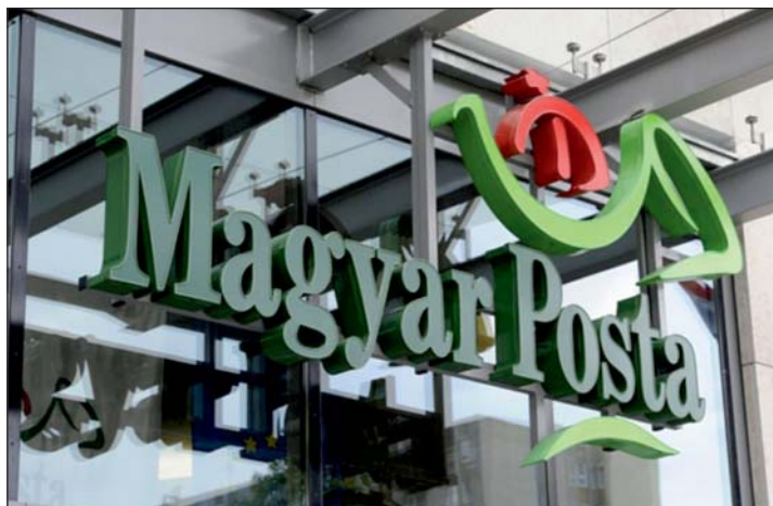
A helyi vegyesboltban üzemel majd a postai szolgáltatás.

Kitérnek arra, hogy a partneri programra való jelentkezés lehetősége folyamatos, a társaság továbbra is várja a lehetséges partnerek jelentkezését.