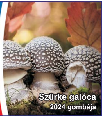
Szürke galóca 2024 gombája