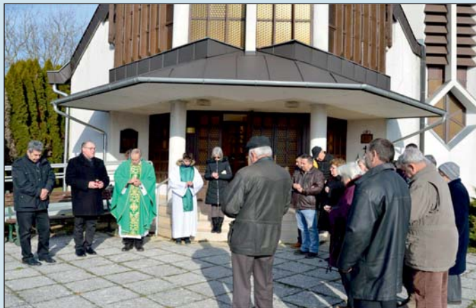
A szentmisét követően a templomnál emlékeztek Zalabaksán az 1943-as eseményekre.