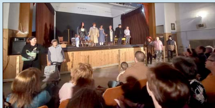
Pillanatkép a szentgyörgyvölgyi bemutatóról.