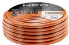
Locsolótömlő NEO 1/2" 20 méter, 4 rétegű Economic 15-800

Az akció a készlet erejéig vagy visszavonásig érvényes. Érdeklődjön személyesen üzletünkben, vagy a megadott telefonszámok valamelyikén. Jelen árak a webshopon nem érvényesek!