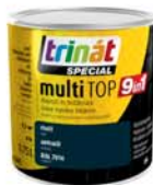
Trinát multiTop 9 in 1, több szín, 0,75 L