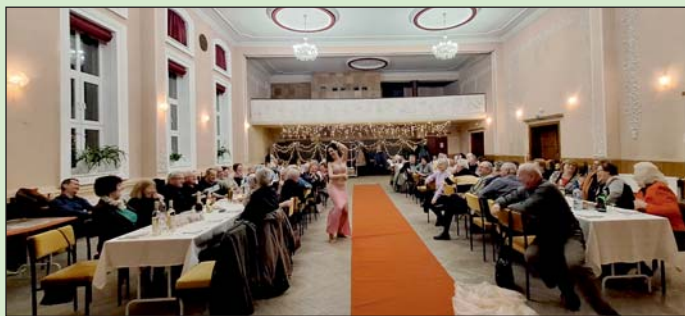
A képen a résztvevők.

Tartalmas programmal kezdődött az év a Lovászi Olajbányász Nyugdíjas Klub tagjainak. Közel 70-en vettek részt a 2024-es év első foglalkozásán.