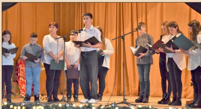
A rédicsi gyerekek, felnőtt segítőikkel adtak műsort az időseknek Rédicson.