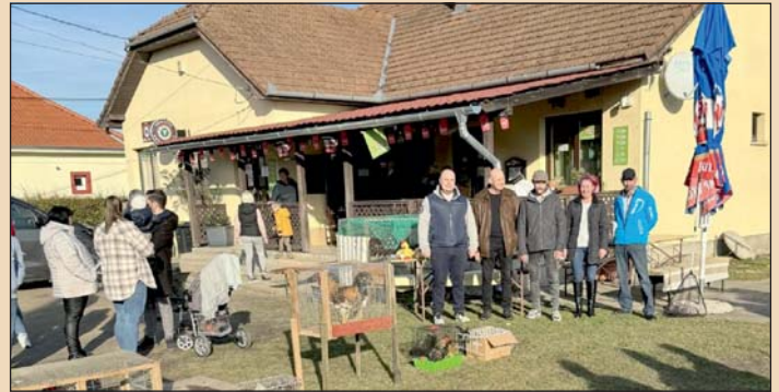
Előtérben a kakasok, jobbra a szervezők és a zsűri tagjai.