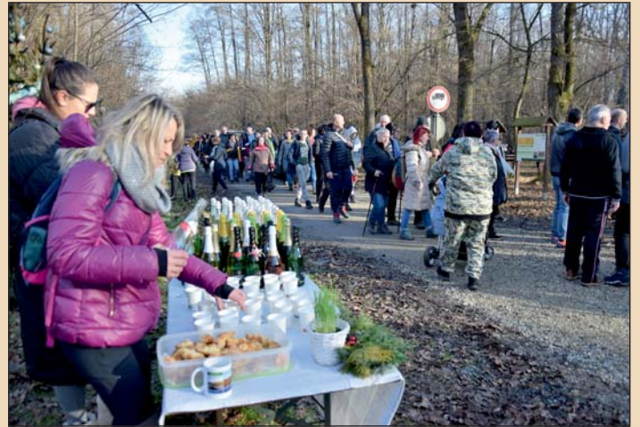
Érkeznek a túrázók a Hetés Barátság Parkba.

Mintegy 300 résztvevő indult el a zsitkóci faluotthon elől, hogy megtegye mintegy 5 kilométer hosszú túrát, hogy a végén a Hetés Barátság Parkba koccintsanak az új évre. A programra számos határ menti és távolabbi zalai településről is sokan csatlakoztak.