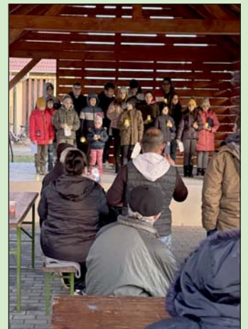
A gyerekek műsort adtak.

A műsor után vendéglátás várta a programon résztvevőket. A szervezők és a fellépők munkáját Paál István polgármester köszönte meg.