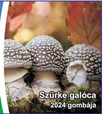
Szürke galóca 2024 gombája