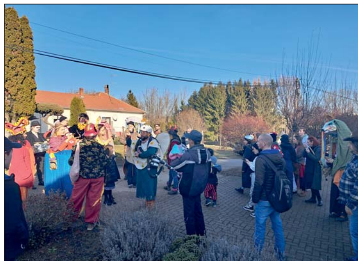
Végigjárták Hottó utcáit.

Már esteledett, mikor visszatértek Hottóra, ahol még további helyszíneken is megfor-