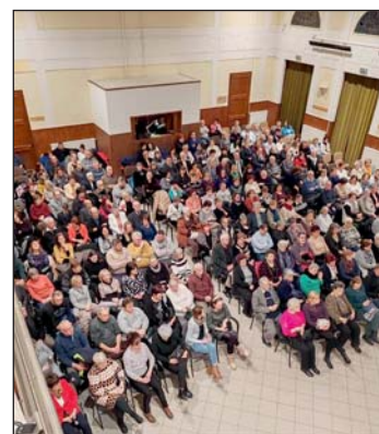
Telt ház a művelődési házban.

Mind a felnőtteknek, mind a gyermekeknek szóló programok hozzájárulnak ahhoz, hogy a település lakossága változatos és színvonal kikapcsolódási le-