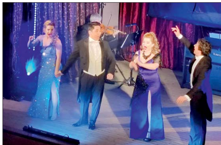
Részlet a Budapesti Operett Színház előadásából.

A település 9 szolgáltatásra adott be pályázatot, ebből 6 eredményes volt. A „Nemzeti Filmklub Program” 10 magyar film megtekintésére ad alkalmat. Ezekon a közös filmnézéseken szakember koordinálásával lehetőség van a film értékelésére. A már megvalósult programok közül legnagyobb sikert a Budapesti Operett Színház „Cintányéros Cudarvilág” című előadása aratta. A közel 300 fős közönség színvonalas és szórakoztató előadáson vehetett részt. A felnőtteknek szóló programok közül sor kerül még egy könnyűzenei koncertre.