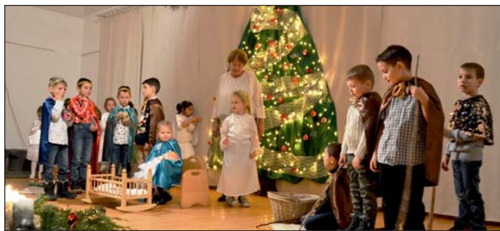
Az óvodások betlehemes játékkal is készültek.