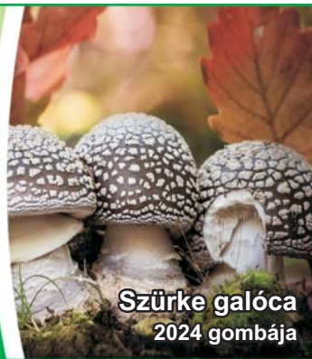
Szürke galóca 2024 gombája