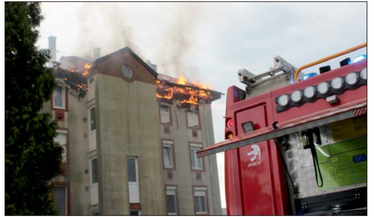
A Holub utcai tüzeset Zalaegerszegen.

Intő jel, hogy a 145 tüzzel érintett otthon közül egyikben