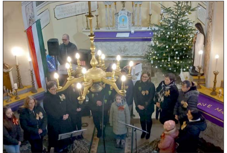
Az ünnepi koncert pillanata...