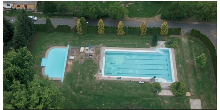
A gellénházi strand.

Gellénházán is, mint minden településen, fontos feladat az önkormányzati utak és jár-