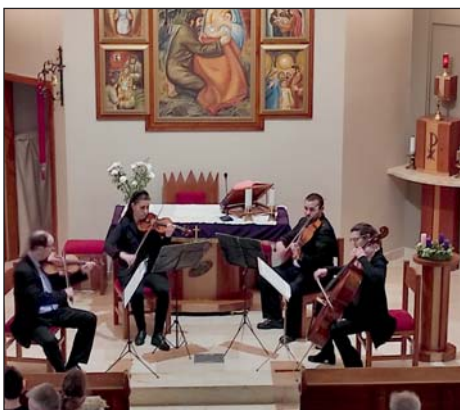
A Berki vonósnégyes műsora.

December elején a jubiláns veradók köszöntésére került sor Teskándon , ahol a Vöröskereszt helyi szervezete az önkormányzattal karöltve vacsorával és ajándékokkal köszönte meg az önzetlen segítségnyújtást. Van olyan veradónk, aki nagyon közel van a 100. alkalomhoz, őt 2024-ben kiemelten fogjuk ünnepelni!