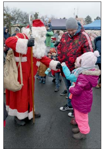
A Mikulás Gellénházára is el látogatott.

A település rendelkezik egy olyan szolgáltatással, amit nem sok falu tudhat magáénak. A kétmedencés, idényjelleggel működő strand nem csak a helyieknek, de a környékben élőknek is kellemes és minőségi kikapcsolódást biztosít. Ennek az intézménynek a felújítására is milliós nagyságrendű összeget terveznek a költségvetésben, és bíznak benne, hogy nyitáskor már egy megújult kismedence és felújított gépészet fogadja a strandolni vágyókat.