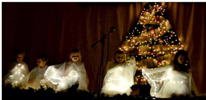
Az ovis angyalkák látványos-bájos produkciója.

December első hétvégén az önkormányzat munkatársai ünnepi díszbe öltöztették a falut. A Hősi emlékműhöz, a Szent Domonkos templomhoz és a Faluházhoz kerültek dekorációk, fények. Az Életfa Nagylengyeli Óvoda-Bölcsőde dolgozói és a gyerekek is minden alkalommal feldíszítik az intézmény épületét és annak környezetét. Talán ezzel is próbálják siettetni kicsit az időt, hiszen a lurkók azok, akik a legjobban várják a decembert, a Mikulás és a Jézuska érkezését.