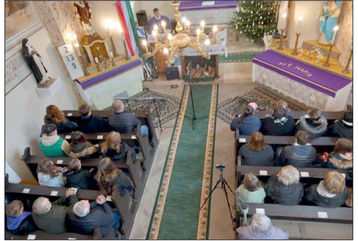
József atya a mise kezdetén.

Az egyesület a 2024-es évben is az elmúlt időszak munkáját folytatva közösségi programokat kínál az érdeklődőknek, a kórus tagjai pedig folyamatosan megújulva műsorok kidolgozását, előadását.