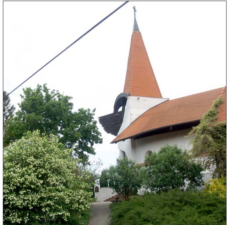
A Makovecz Imre által tervezett templom.