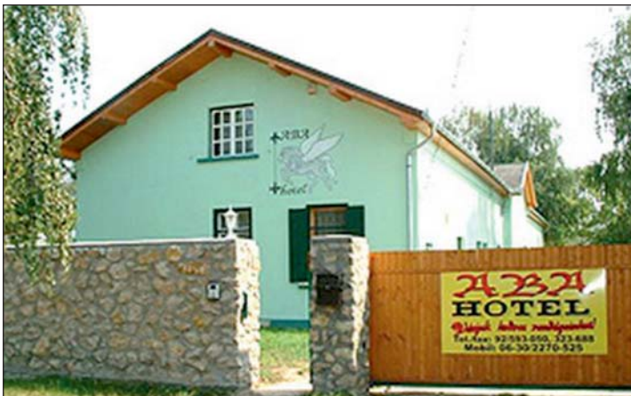
Már csak emlék az egykori állomás, majd hotel.