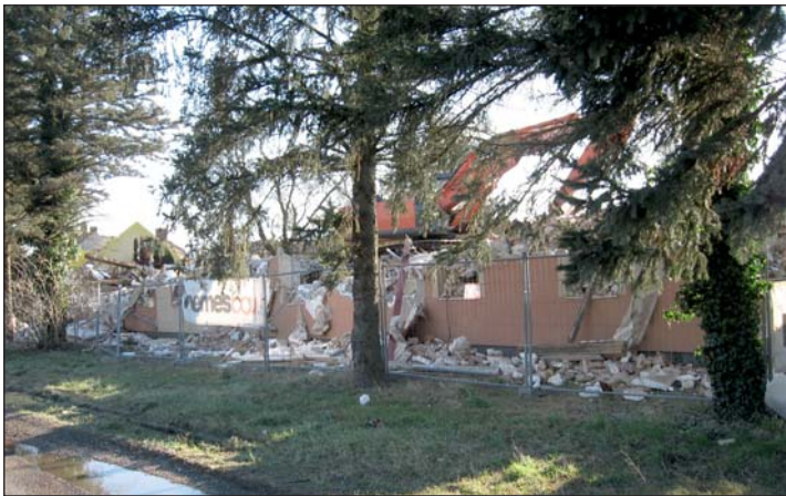
Bontják az Aba Hotelt.

A projekt keretében Zalaszentivánon megkezdődtek a bontási munkálatok. A napokban az egykori Aba Hotel szanálására került sor.