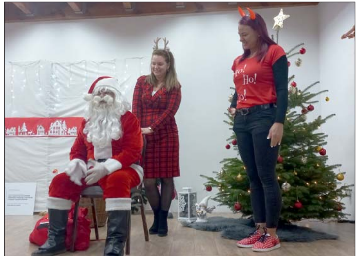
A faluházba is ellátogatott.