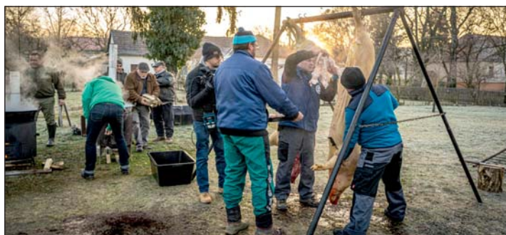
A disznó bontása.