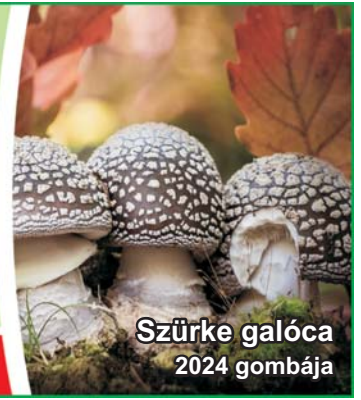
Szürke galóca 2024 gombája