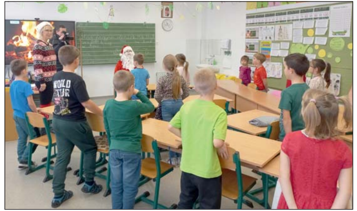
A Mikulás az iskolában.