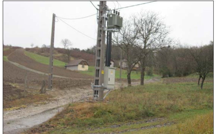
A külterületi utakra ráfér a felújítás.

nyertünk 129 millió forintot, s ez is megvalósult. Ezzel egy nagy gondot sikerült megszüntetni.