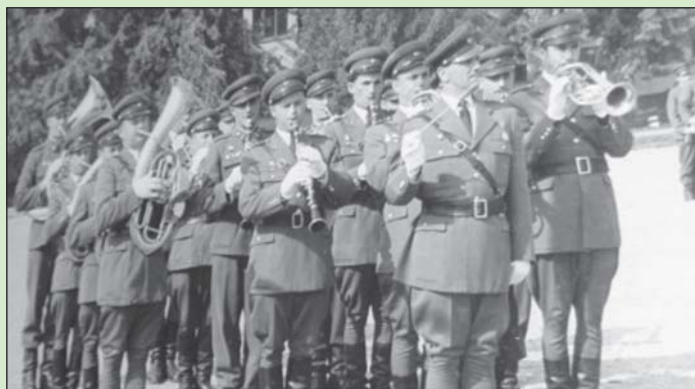
A zenekar élén...