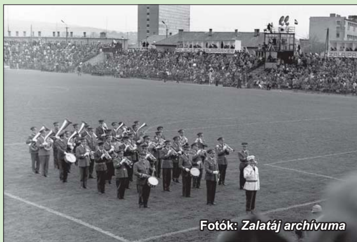
Fotók: Zalatáj archívuma

Többször is fellépett az Ódry Lajos által vezényelt katonazenekar a ZTE-stadionban. Felvételünkön az 1974. március 31-én lejátszott Magyarország - Bulgária (3-1) válogatott mérkőzés előtt szórakoztatják a zsúfolt stadion közönségét. A fotót Markó Béla küldte szerkesztőségünknek.