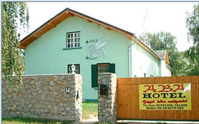
Már csak emlék az egykori állomás, majd hotel.