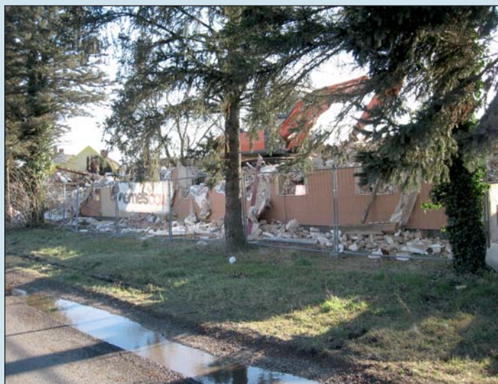
Bontják az Aba Hotelt.

A projekt keretében Zalaszentivánon megkezdődtek a bontási munkálatok. A napokban az egykori Aba Hotel szanalására került sor.