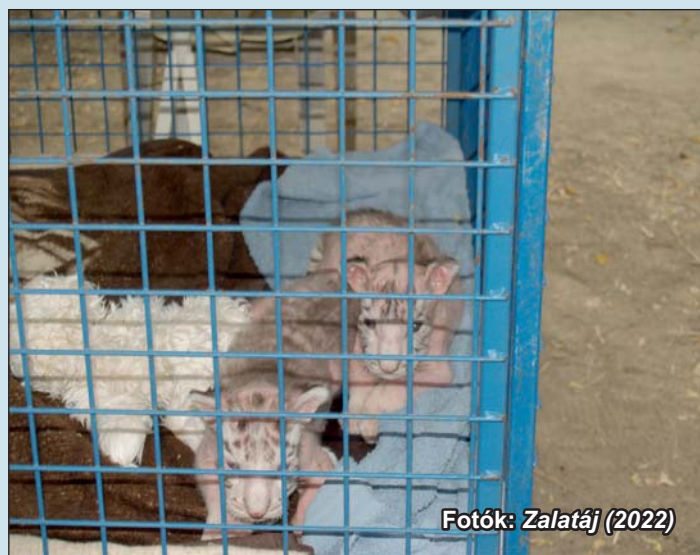
Fotók: Zalatáj (2022)