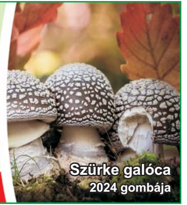
Szürke galóca 2024 gombája

Megyei havilap XXXVI. évfolyam 870. szám 2024. 01. 18.