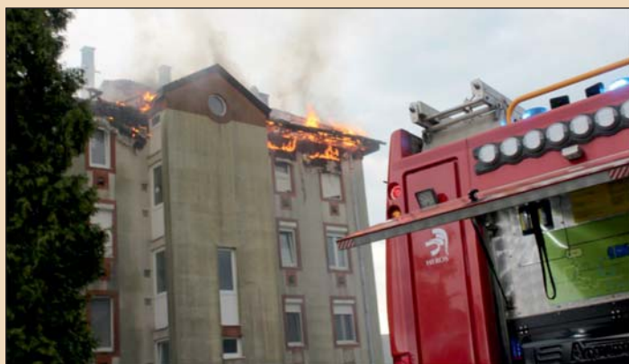
A Holub utcai tüzeset Zalaegerszegen.

A leghosszabb beavatkozás Zalaegerszegen történt, május 6-án, amikor is kigyulladt egy