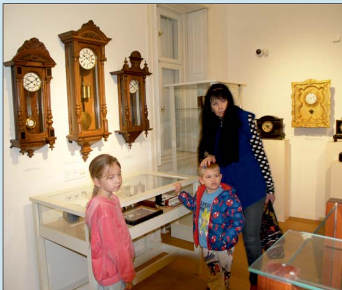
A kisgyermeket is érdekelte a kiállítás.