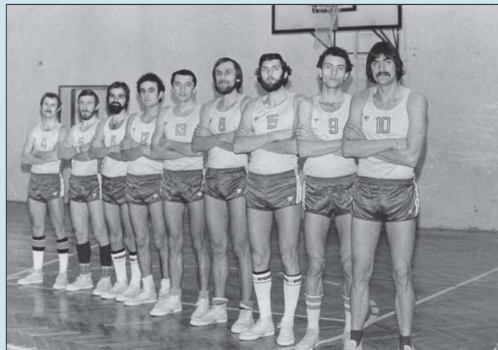
A Zalaegerszegi Építők csapatában (jobbról az első).

„Fantasztikus volt az egerszegi közönség...”