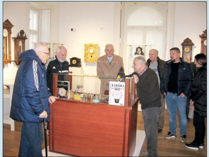
Baráti társaságban, mint „tárlatvezető”.

– Előfordult, de nagyon ritkán. Ám ha rosszul állapítottam meg a javítás költségét, aztán kiderült, hogy sokkal nagyobb a baj, s többet kell dolgozni a reparáláson, akkor sem kértem többet.