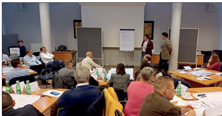
Közös projektet dolgoztak ki ifjúság témakörben.