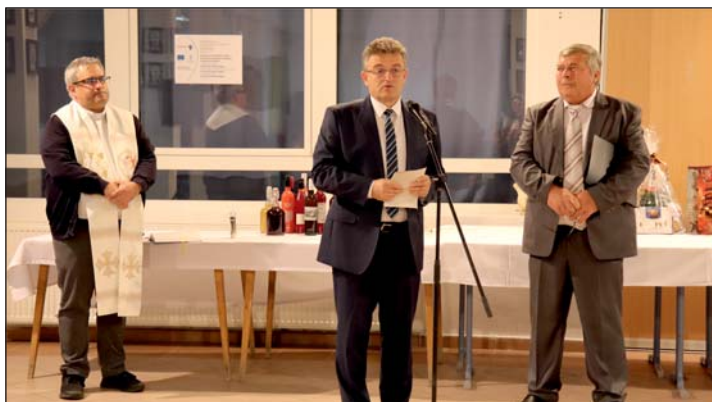
Márton napi boráldás.