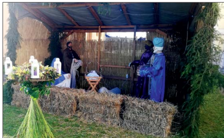
Betlehem a zalalövői templom előtt.