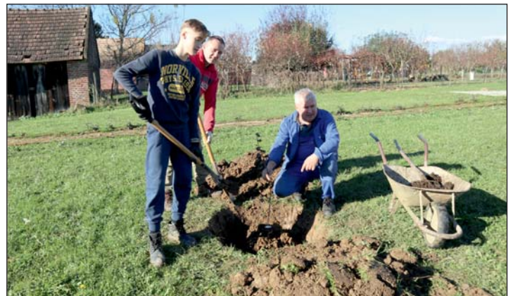
Faültetés a Tájháznál.

Közösségi munkára gyűltek össze a Zalalövő Tájháza Egyesület tagjai a Tájháznál ahol a közösségi kemence melletti területen terepet rendeztek, fát ültettek, faépületet festettek, a kemence fűtéséhez szükséges fát vágták össze. A területen több barackfa került elültetésre, valamint az önkormányzat által adományozott Petőfi kőrtéfa is.