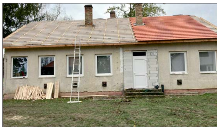
A szépülő tetőszerkezet.