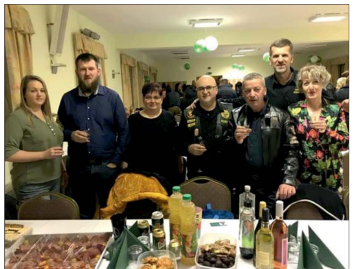
Képen a Road Wanderers motoros klub tagjai a bálon.

A bevétel végül több mint fél millió forintra rúgott, amit a szervezők teljes mértékben a tófeji és a gutorföldi iskola