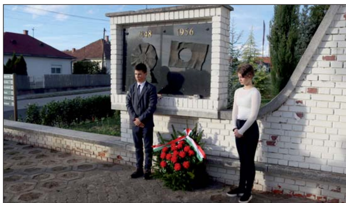
Emlékezés az ünnepnapokon.

A legkisebbeket Mikulás város rendezvény hangolja a téli ünnepekre. A „reptéri” parkoló-