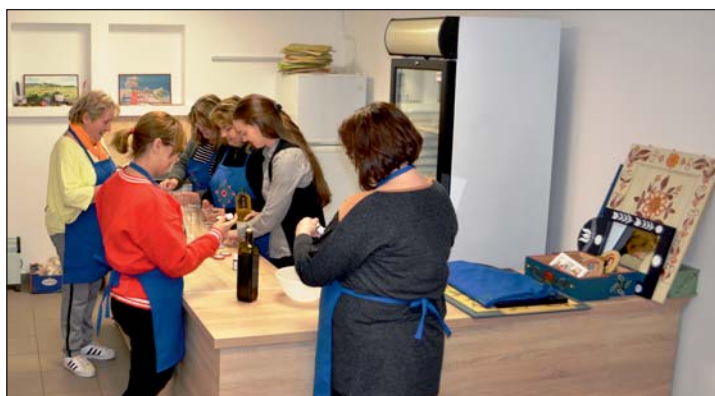
Készülnek a természetes kozmetikumok.