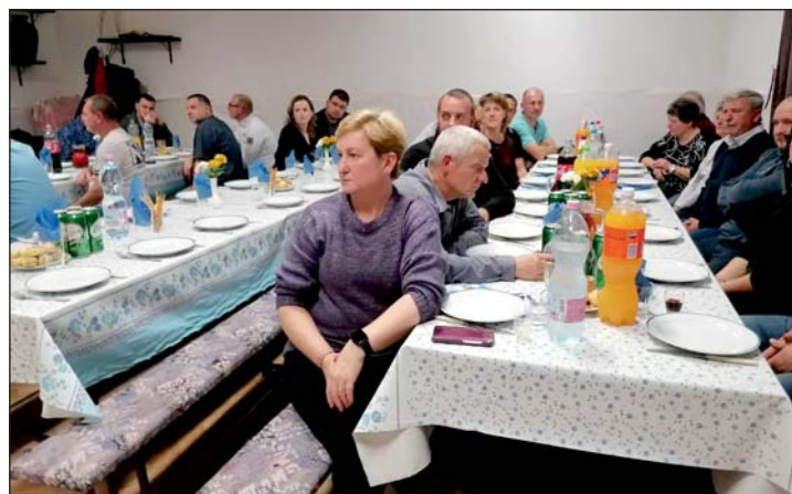
Már hagyomány az év végén tartott vacsora.

Már hagyomány Babosdöbrétén , hogy az év végéhez közeledve vacsorával, hangulatos esttel látják vendégül az önkormányzatot támogató vállalkozókat és civileket egyaránt. Baráti hangulatban jó kedvvel telik az est, kicsit megpihenve az egész éves hajtás után.