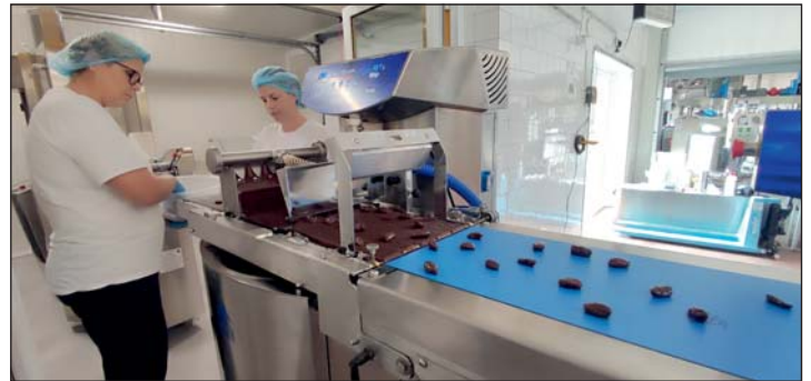
10 éve gyártanak glutén- és allergénmentes pékárukat és péksüteményeket.

úgyis extra a termék minősége, akkor legyen még jobban az.