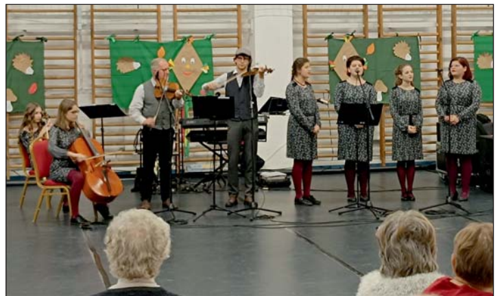
A Völgyi-banda is szórakoztatta a szépkorúakat.