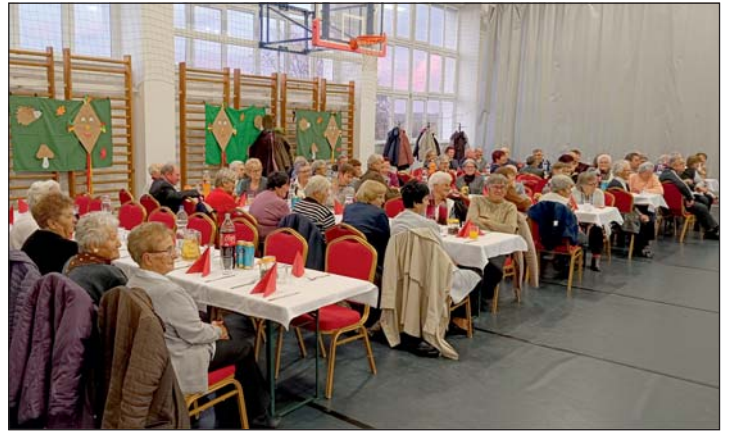
Sokan részt vettek a találkozón.