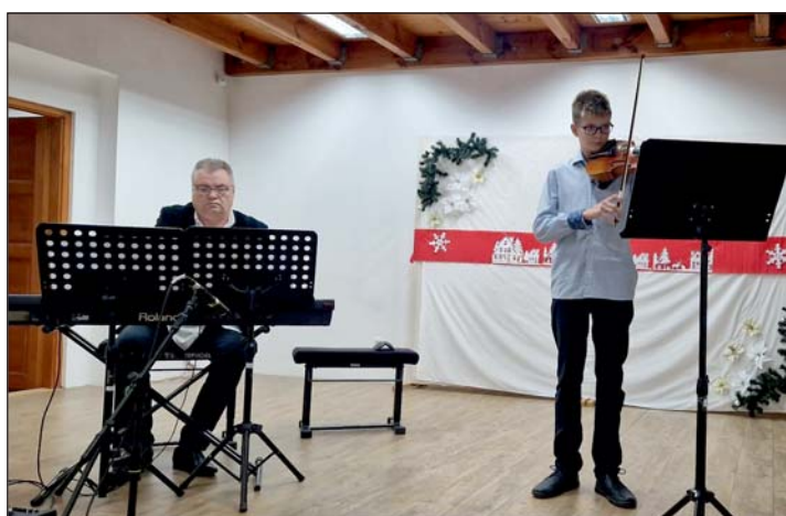
Kitűnő alkalom volt az ünnepre hangolódásra.