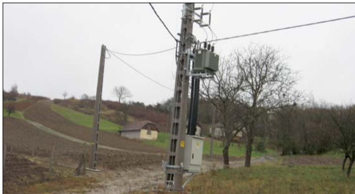
Az új trafóállomás.