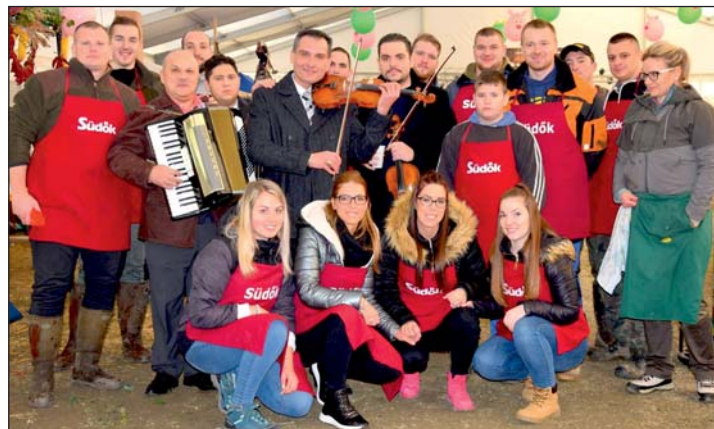
A Mura-menti Malacságok jövőre ünnepli tizedik születésnapját.

A fesztivál szívét a versenyző csapatok jelentik, akikkel rendszeresen egyeztet az a keresztúri önkormányzat a program alakulásáról. A Mura-menti Malacságokat immár tizedik éve szervezik meg a kormány és a helyi vállalkozók hathatós támogatásával. A faluvezetés bízik benne, hogy a jubileumi fesztivált is méltó módon meg tudják majd ünnepelni, és a több ezer vendégnek felejthetetlen élményben lesz része.