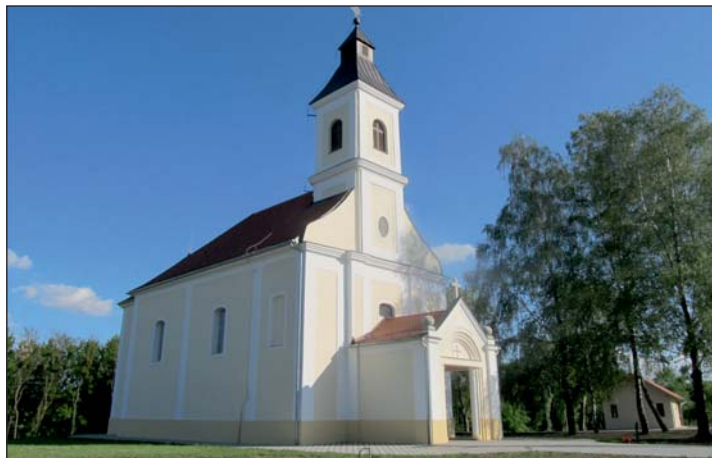
Közös gyertyagyújtással ünnepelték az advent kezdetét a keresztúri templomban.

a Zrínyi Miklós Általános Iskola diákjai és a keresztúri óvodások is. A plébánia udvarán adventi vásárt is tartottak a keresztúri ovi, a balatonmáriafürdői Regens Wagner Otthon és a budapesti Mária Kegytárgy Kereskedés közreműködésével.