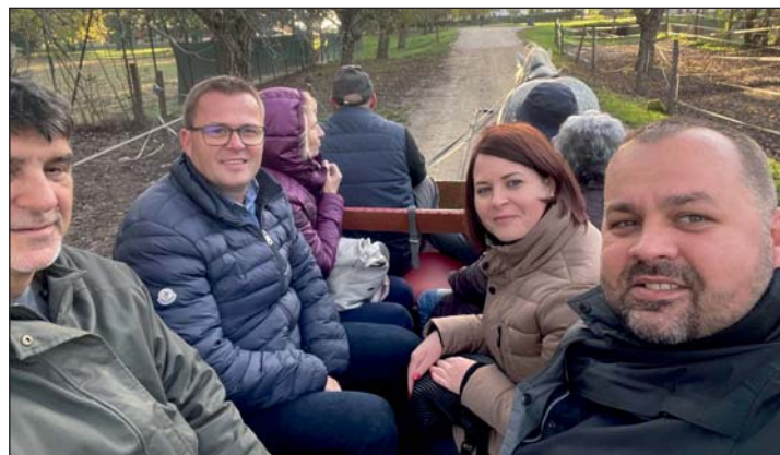
Ráckeresztúr után Murakeresztúron szervezik meg a keresztúriak nagy találkozóját.