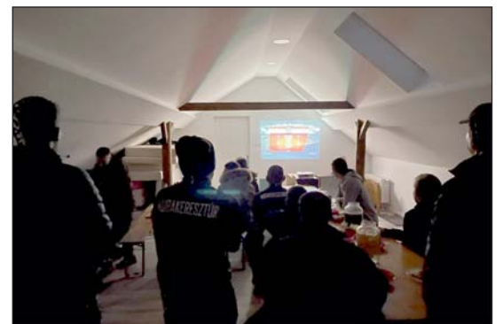
Hajrá, Magyarország! Hajrá, Keresztúr!

Szoboszlai Dominik pályázati jóváhagyásáról döntött. A Climate Champions projekt célja, hogy javítsa a határ menti régió felkészültségét és ellenálló képességét az éghajlatváltozás hatásaival szemben, és hozzájáruljon a helyi CO 2 -kibocsátás-csökkentési eredményekhez a klímadatastos életmód népszerűsítésével. A HyperBOT projekt a hiperbár oxigénterápia hatásainak a hazai és osztrák partnerekkel, köztük a grazi orvosi egyetemmel (Medizinische Universität Graz) közös kutatását, a kezelések hatékonyságának bizonyítását és az eljárás népszerűsítését célozza.