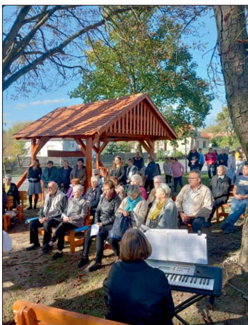
Ünnep a kútnál...

Jeles hagyomány indult útjára (vagy inkább új életre kelt, hiszen Vendel szobrát a múlt század harmincas éveiben emeltette a falu egy lakója, és úgy hiszem, hogy ennek a békés, botjával a jószágainak itatására