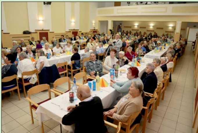
A vendégek az ünnepségen.