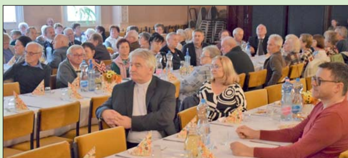
Szépkorúak és vendégek az ünnepségen.

Lovászipan október végén tartottak ünnepséget a szépkorúaknak. Kovács Ferenc polgármester mondott köszöntőt, melyben kiemelte, hogy ez a nap az idősök napja, minden évben figyelmet szentelnek rájuk, hisz ők már megtették, amit vártak tőlük, lelkiismeretes, becsületes, szorgalmas munkával, s most a pihenés, gondoskodás éveit kell, hogy következzenek.