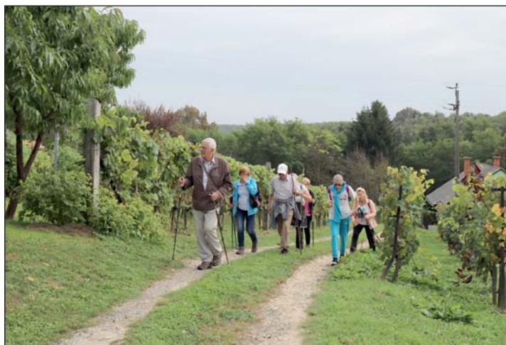
Képen a Menő Manó csapat tagjai Pataka-hegyen.