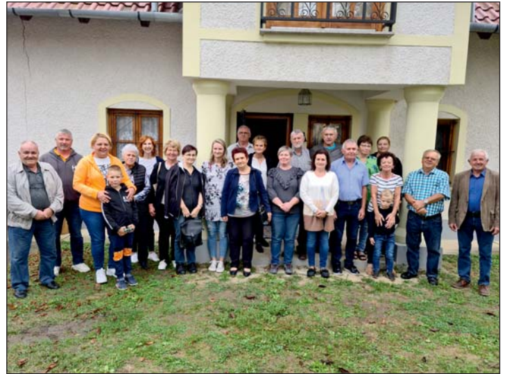
Egy közös fotó a horvátországi vendégekkel.

A polgármester köszöni a látogatás előkészítésében, lebonyolításában résztvevők tev-