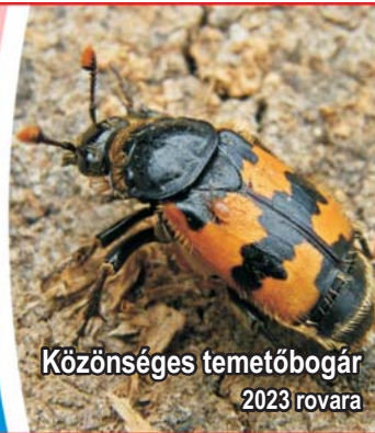
Közönséges temetőbogár 2023 rovára