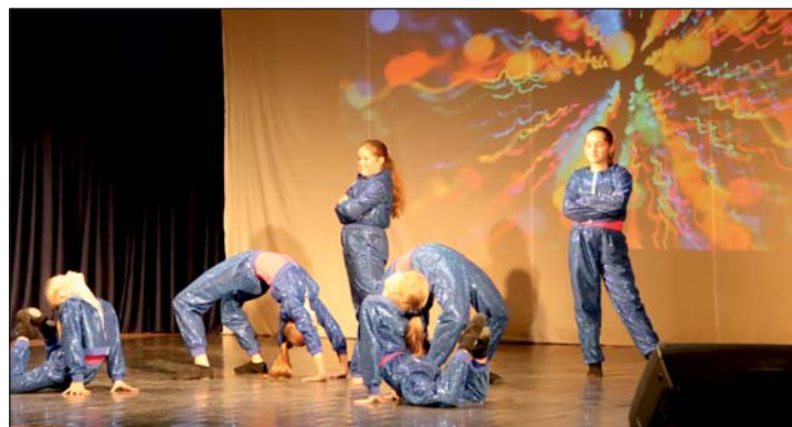
A képen a Tornyos Tánclub zalalövői csoportja.