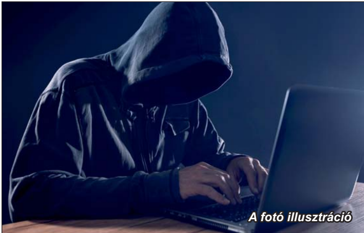
A fotó illusztráció