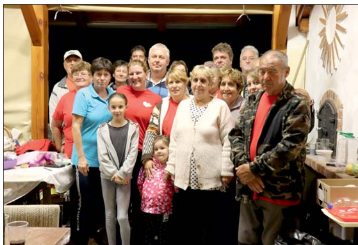
Képen a szervezők, segítők csapata.