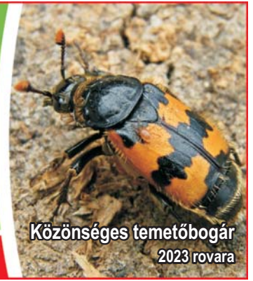
Közönséges temetőbogár 2023 rovára