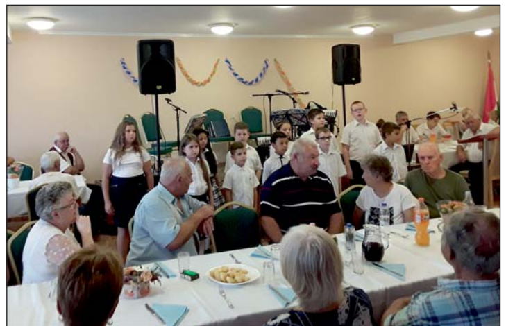
A zalacsányi iskola diákjai adtak műsort.

TIT Öveges József Ismeretterjesztő és Szakképző Egyesület