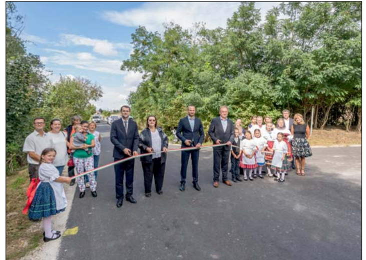
Több szempontból is fontos az útszakasz.

felé is. Emellett mezőgazdasági gépek is erre közlekednek, tehát lényeges gazdasági funkciót is betölt. Igen fontos a vasúti csatlakozás elérése szempontjából is.