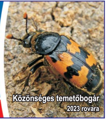
Közönséges temetőbogár 2023 rovára