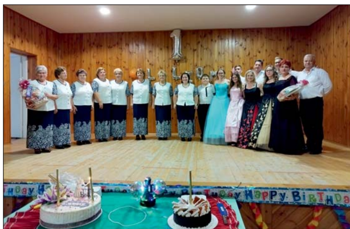
A képen balról jobbra: Fürge Ujjak Népdalkör és LiliumDance Táncsoport.