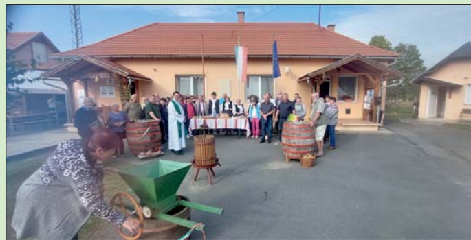
A leszüretelt szőlőt is feldolgozták a fesztiválon.