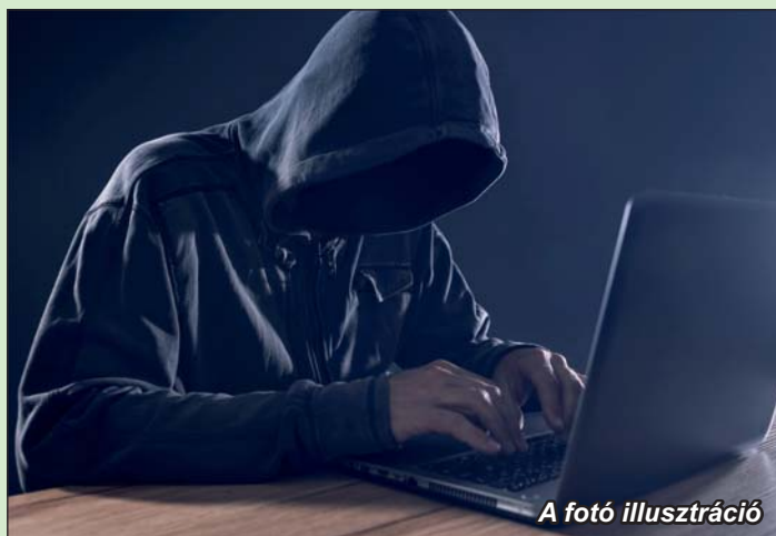
A fotó illusztráció

• Legyenek óvatosak az ismeretlen telefonálókkal!