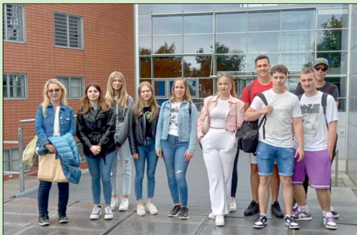
A Pákai Német-Magyar Baráti Kör fiataljai Németországban.

A környezetvédelem a kiemelt témák között szerepelt