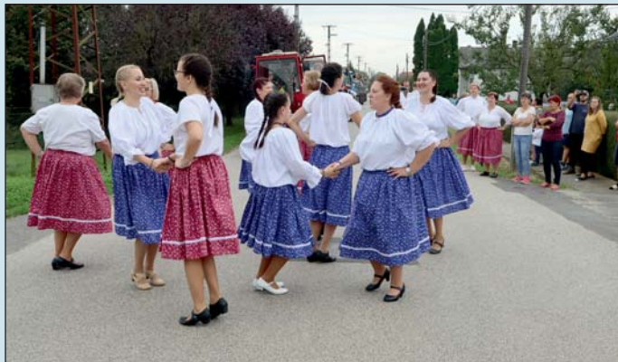
A lányok-asszonyok tánccal készültek a programra.

A nap végén – az egyesület tagjai által készített – finom perecekkel, kalácsokkal, gulyással vendégelték meg a résztvevőket és az ide látogatókat.