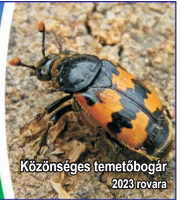
Közösséges temetőbogár 2023 rovára