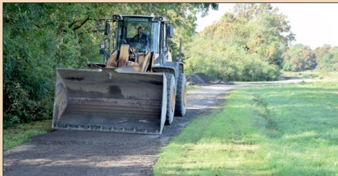
Bazaltkővet terítették az útfelületre.

Hozzátette, hogy fontos ez az út, mert összeköttetést biztosít Hetéssel, Szlovéniával, illetve a turisták is használják.