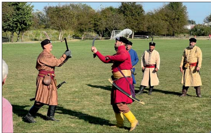
Nagy sikere volt a hagyományőrző egyesület bemutatójának.

ramoknak, hanem a Leader támogatással megvalósult 200 m 2 -es fedett rendezvénytér. Az elmúlt időszak árobbanása csaknem ellehetetlenítette a projekt megvalósulását, ám az önkormányzat úgy látta, hogy szükséges hiányt pótol az épület, hiszen a településnek nincs igazán lehetősége nagyobb rendezvények megtartására, mert a Kemenceház maximum 40 fő befogadására alkalmas, az iskola tornaterme pedig nem mindig hozzáférhető. A 10 millió forintos támogatás nyilván a beruházás