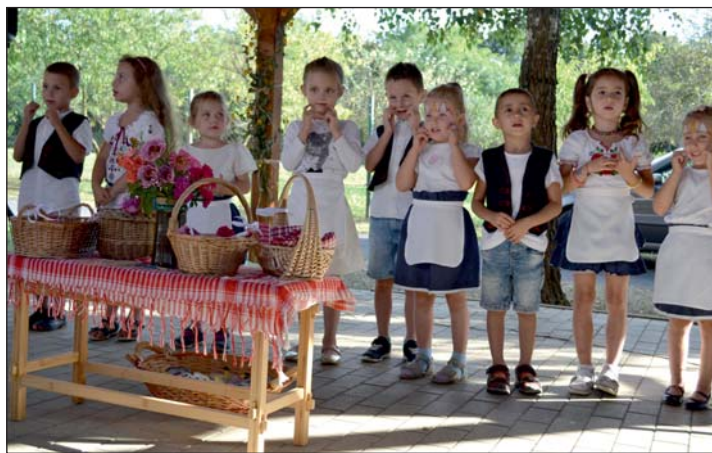
Pillanatkép az óvodások kedves műsorából.