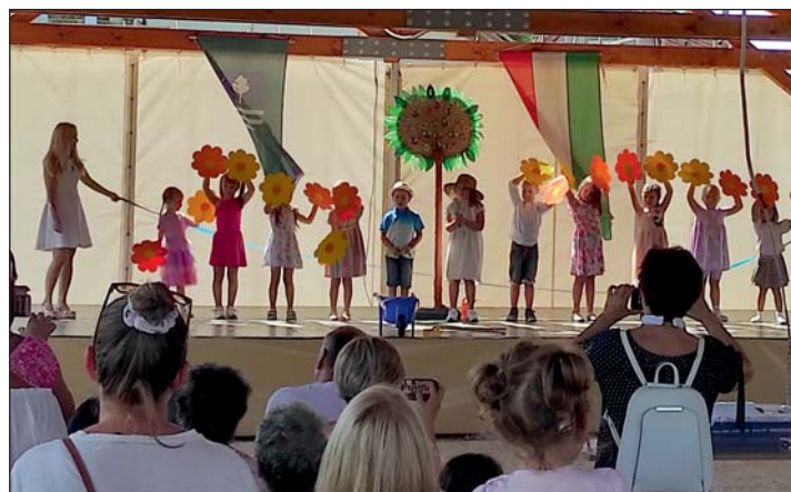
Az óvodások műsora.