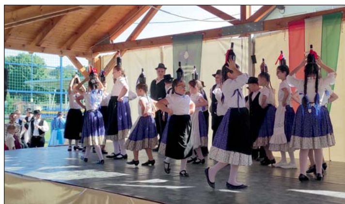
Színpadon a néptáncosok.