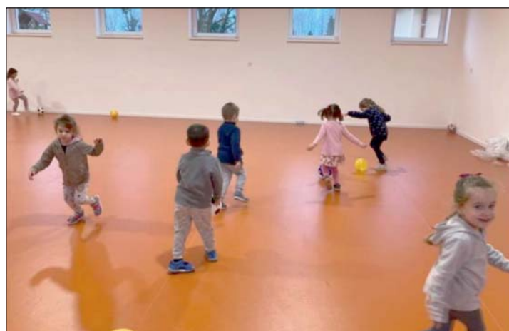
A mindennapos tervszerű testmozgás óvodás korban is elengedhetetlen. Ezt segíti a zalaszentiváni tornaszoba.

ió forintot, Zalaszentiván Község Önkormányzata saját erőből 33 millió forinttal járult hozzá a tornaszoba elkészüléséhez. Jelenleg 84 gyerek jár ide – mondta a szeptember 14.-i átadáson Dorján Miklós polgármester.