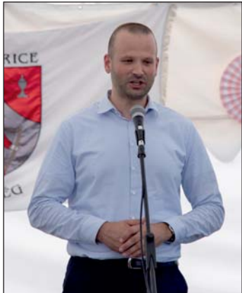
Nagy Bálint országgyűlési képviselő elismeréssel szólt az eseményről.

A megnyitó ceremónia mély érzelmeket keltett a résztvevőkben, amikor a megható „Nélküled” című dal szavai töltötték be a teret. Ezt követően a Magyar és a Székely Himnusz hangjaira az egész vendégsereg talpra állva ünnepelte meg a pillanatot. A zene vibrálása és a nemzeti büszkeség érzése együttesen töl-