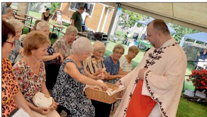
Szentmise és kenyérszentelés is volt.

A jobbnál jobb előadók között a szervezők sort kerítettek tombolasorsolásra is, ahol nagyon sok értékes ajándék került átadásra, melyeket helyi és környékbeli magánszemélyek, illetve vállalkozók ajánlottak fel.