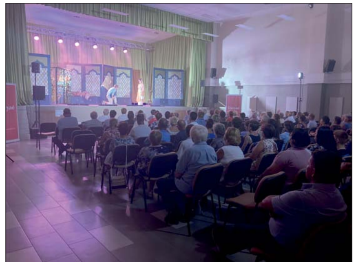
Igazi feltöltődést, kikapcsolódást jelentett a darab.