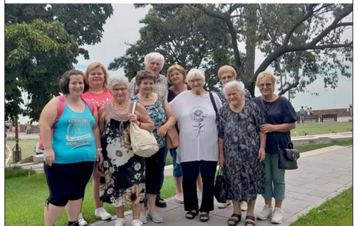
A kiránduló csapat Tihanyban.