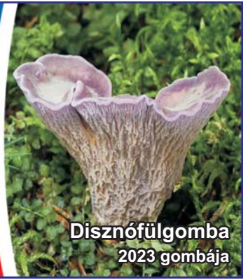
Disznófülgomba 2023 gombája