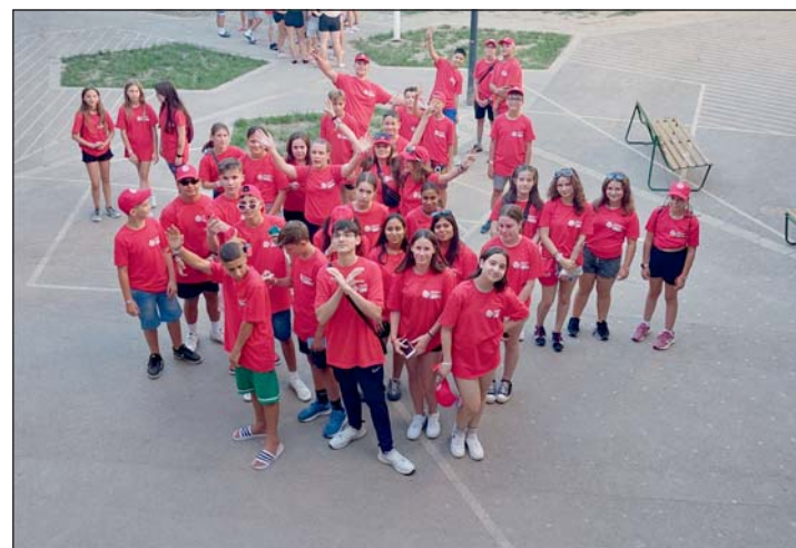
Felejthetetlen nyaralás volt.