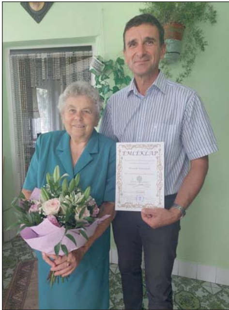
A polgármester köszöntötte az ünneplést.

1976-tól a Takarékszövetkezet pacsai fiókjában dolgozott egészen 1999-ig, a nyugdíjazásáig. A munka mellett a szőlőhegyen, konyhakertben is sokat dolgozott, állatokat is neveltek. Ma is szívesen tevékenykedik a ház körül, gyermekei és az időközben született 4 unokája is szívesen fogyasztja a megtermelt zöldséget, és a mama sütijeinél sincs jobb.