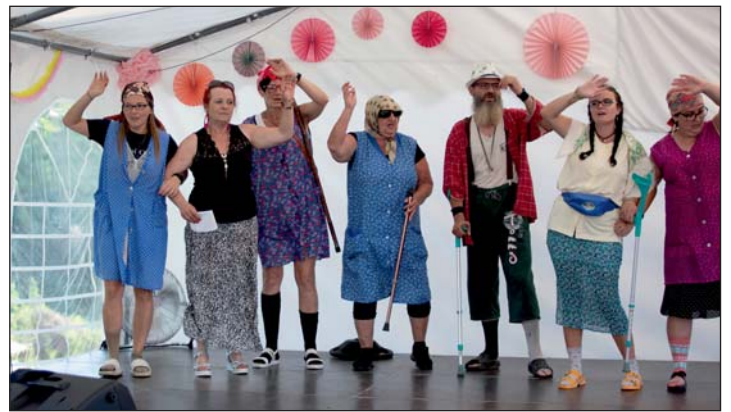
A jókedvről a helyiek meglepetésműsora gondoskodott.

ricén olyan esemény volt, amely nem csak a helyiek közösségét erősítette meg, hanem az egész régió számára is fontos üzenetet hordozott. A különleges pillanatok, az ünnepi ceremóniák és a szórakoztató programok egyaránt hozzájárultak ahhoz, hogy a rendez-