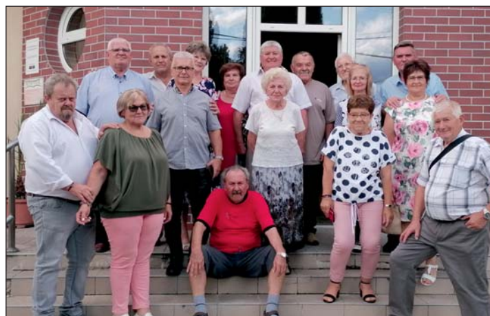
... és most.

lyen iskolát sikerült elvégeznie, mit ért el az életben az ötven év alatt. Mindenki emlékezett valamilyen diáksínyre. Jó volt emlékezni, visszaidézni a múltat és csodálatosképpen minden