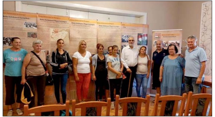
A roma holokausztot bemutató vándorkiállítás Szentpéterúron.

zett áldozataikra. Az évforduló napja azért lett augusztus 2-a, mert Auschwitzban, az Auschwitz – Birkenau II. E táborban (cigány táborban) 1944. augusztus 2-ról, 3-ára virradóra több mint háromezer cigány származású embert, férfit és nőt, gyereket és időset végeztek ki a tábor felszámolása miatt. Akikkel nem végzett az éhség, a járvány, akik megélték még ezt a napot ott a táborban, reménykedtek abban, hogy túlélnek; egy éjszaka alatt kiírdóztak az emberiség testéből. A gázkamrák felé tereléskor – a visszaemlékező német őr leírása szerint – rájöttek a cigány férfiak a szörnyű tervre, és fegyvertelenül is megpróbálták ellenállni. A küzdelem eredménye csak annyi volt, hogy a gáz