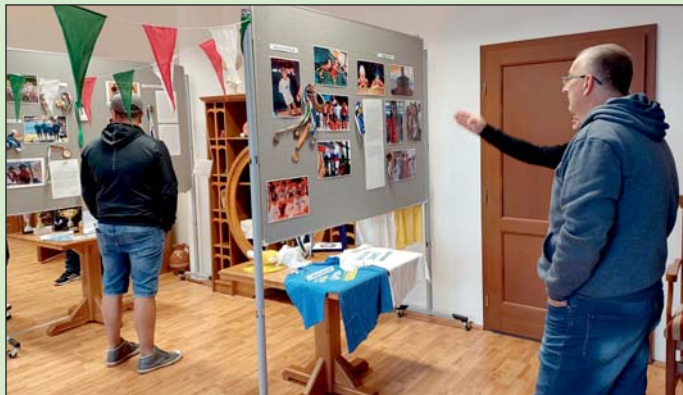
Tárlaton mutatták be az úszóklub történetét.

Kiállítás is nyílt, mely az úszóklub történetét mutatta be. A tárlat anyagának – fotók, dokumentumok, érmek, díjak, egyéb tárgyak – összeállításában a városi könyvtár munkatársai segített az úszóklubnak.