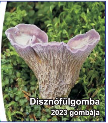
Disznófülgomba 2023 gombája