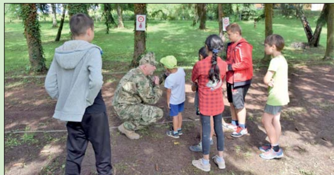
A honvédség képviselői is felkeresték a tábor, segítségükkel a lövészzettel ismerkedtek a gyerekek.