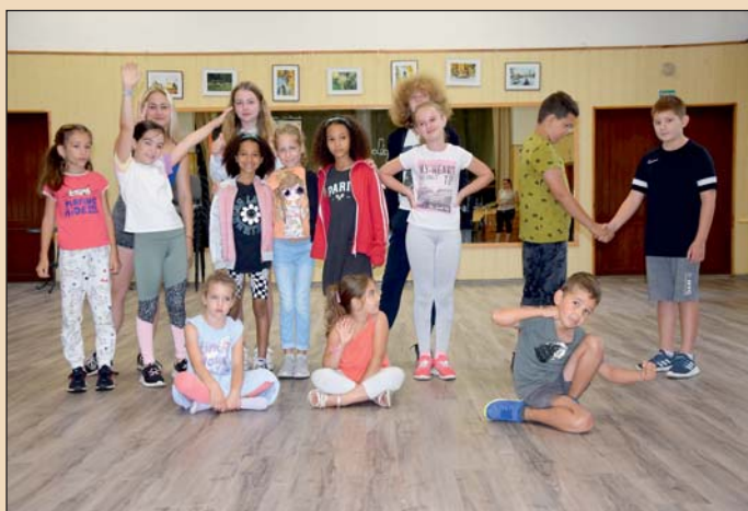
Képen a táborozók.

Idén augusztus elején 11. alkalommal került sor a hagyományos színjátszó táborra Nován . A táborba 6-14 éves gyerekeket vártak.