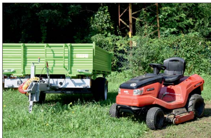
A közel 4 millió forint értékű pótkocsi és a többi eszköz is nagy segítséget jelent.

Leader-pályázaton vásárolt kommunális eszközöket Zalabaksa önkormányzata.