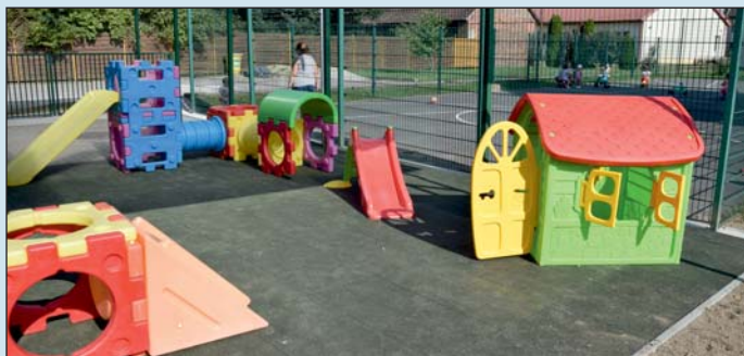
A bölcsődében gumiborítású játszórészt alakítottak ki.

A polgármester hozzátette, hogy a helyi óvoda és a bölcsőde is maximális kapacitással működik, előbbibe több mint 70, utóbbiba 14 gyermek jár, az iskola tanulói létszáma pedig közel 170 fő.