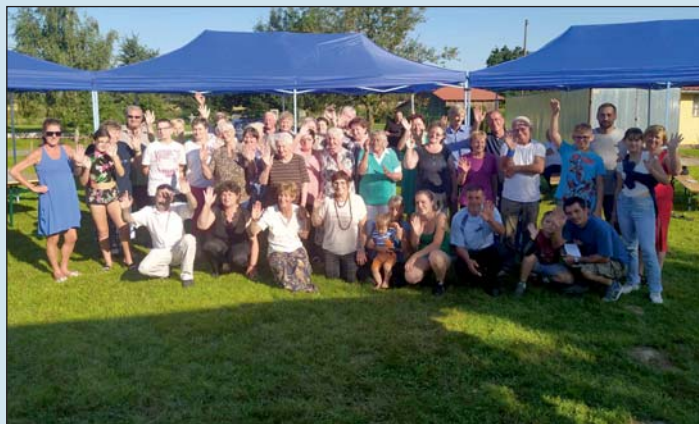
Tizenegyedik alkalommal került sor a rendezvényre.