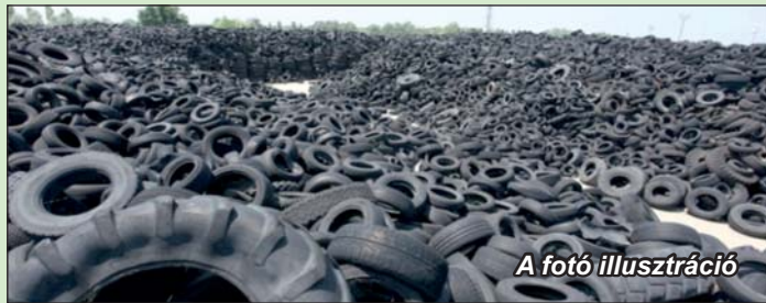
A fotó illusztráció

települést rendezettségéről, közterületeinek ápoltságáról ismerik. Ezt támasztják alá a Virágos Magyarország Környezet-szépítő versenyben a város részére magas színvonalú, hosszútávon fenntartható települési környezetért elnyert elismerések, mely a lakosság és az önkormányzat közös munkájának eredménye. Működik a zöldkommandó, ahol az önkormányzat, a rendőrség, a polgárőrség és a hulladékkezelő ügyel arra, hogy a lakóterületen ne helyezzenek el hulladékot. Számos gyűjtőpont áll rendelkezésre a háztartásokban keletkezett hulladék szelektív elhelyezésére, ezeket kamerákkal figyeljük. A nyár folyamán a Momentum országgyűlési képviselője adott közösségi média-felületen tudósítást a Lenti-zajdai laktanyában tárolt autógumikról. Erkezését nem jelezte, a területre is engedély nélkül jutott be. Az akció politikai indíttatású volt, a hulladék tulajdonosának kormányközeli kapcsolatait kutatta, ugyanakkor arra is utalt, mi lenne akkor, „ha ez itt begyullad”. Szakemberek szerint az autógumi gyulladási hőmérséklete 300°C,