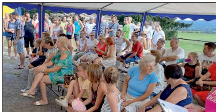
Vidám műsor várta az érdeklődőket.