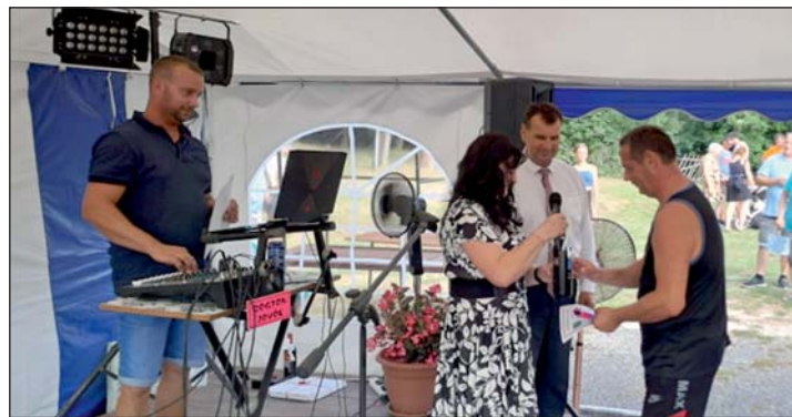
Elismeréseket adtak át.