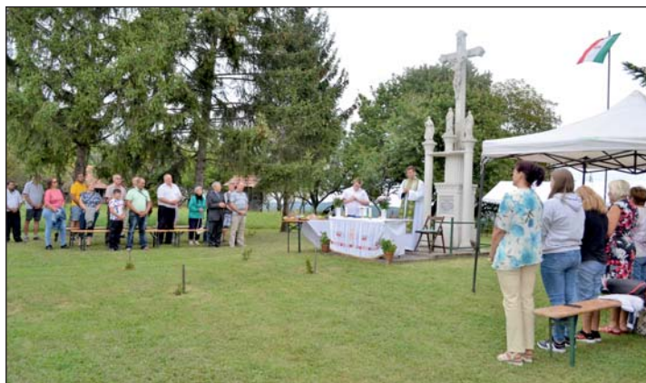
A szentmisét terményáldás követte.