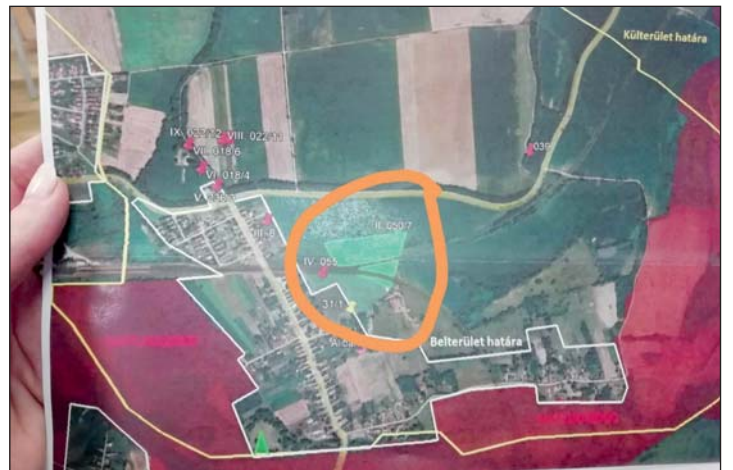
A tiltakozás miatt új helyen lesz a torony.