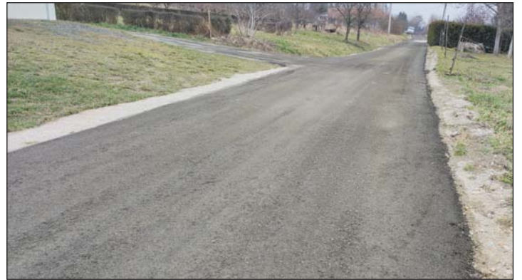
A hegyi utakról sem feledkeznek el.