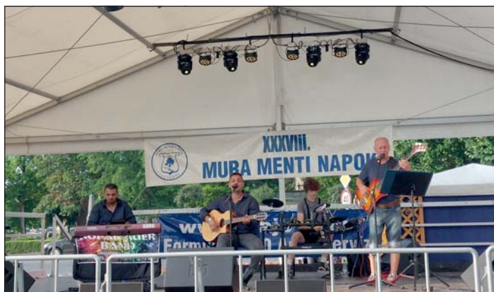
Auer - Kopár band nosztalgia dallamai.