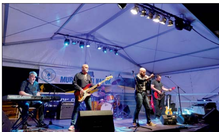
Best of Queen - Grazy Little Queen Tribute Band koncert.