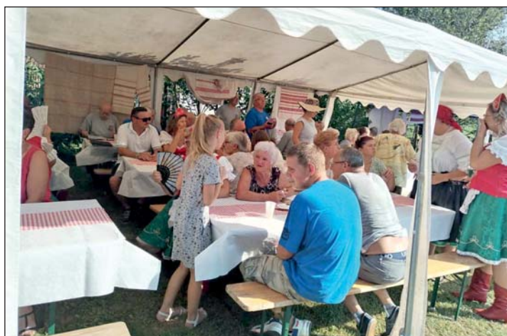
Megtelt a sátor az ünnepi hétvégén a Muramenti Paraszportán.