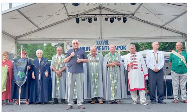
Augusztus 19. Mura Menti Bornap és kulturális programok a szabadtéri színpadon.