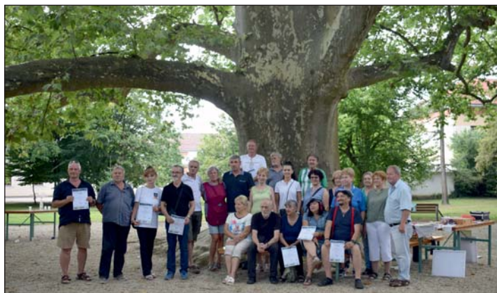
Augusztus 18. XXVII. Mura Art Nemzetközi Festőszimpózium.