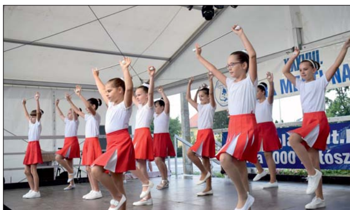
Hóvirág Mazsorett csoport.