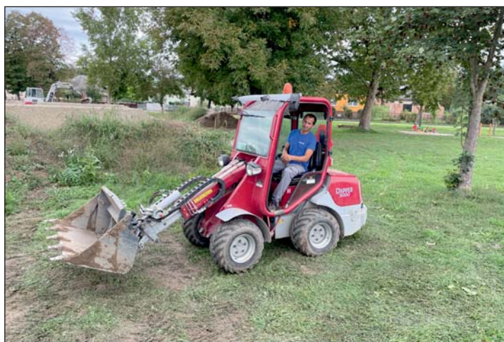
Ezt a sok munkát már csak géppel győzik a keresztúri karbantartók.

A sok esőnek és a melegnek köszönhetően belobbant a természet augusztusban a megyében. Murakeresztúr kiterjedt zöldterületének gondozása is extra erőfeszítést jelentett az önkormányzat dolgozóinak. Hogy a megnövekedett mennyiségű munkát hatékonyabban tegyék és felgyorsítsák, kölcsön kértek egy nagy teljesítményű mulcszózó adaptert, amit az önkor-