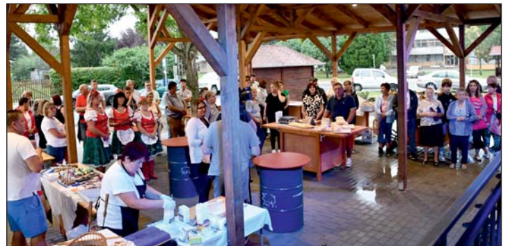
Megtelt a fedett piactér az árusokkal és az ünneplőkkel. Helyi finomságokat és igényes kézműves termékeket is lehet kapni az új piacon.

vendégek helyben tudjanak minőségi alapanyagokat, gyümölcsöt, zöldséget, pékárut, tejterméket beszerezni. Senkinek ne kelljen a városba mennie, ha finom ételekre, minőségi termékekre van szüksége. Murakeresztúr minél inkább önállóvá válhasson, a helyi kereskedőknek, termelőknek és kézműveseknek lehetősége nyíljon helyben értékesíteni terméküket. Közös sikerünk, közös büszkeségünk ez, amely nem jöhetett volna létre az összefogásunk nélkül. Minden keresztúriak, minden helyi vállalkozónak köszönöm a közreműködését” – nyilatkozta az átadón a falu polgármestere.