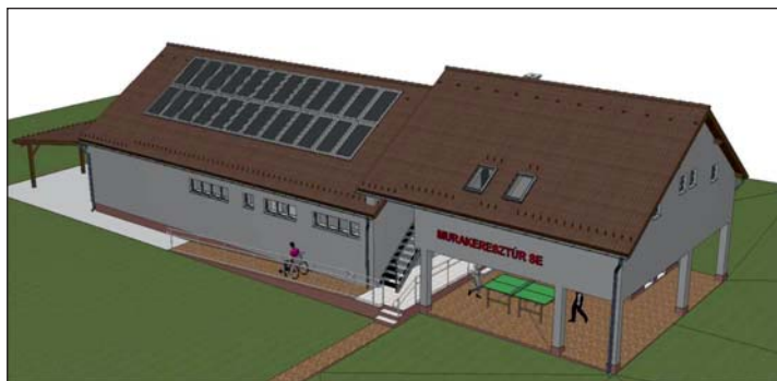
Látványterv a Deák-Gizmó Murakeresztúr SE bővülő és megújuló öltözőjéről.