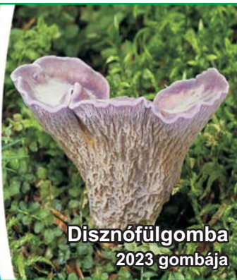
Disznófülgomba 2023 gombája