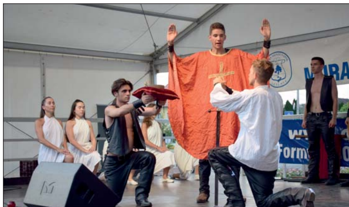
István a király - Eurodance Táncszínház.