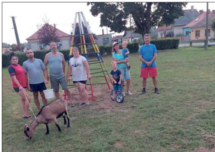
Családi és baráti összefogással újították fel a romos játszóteret Keresztúron.

„A karbantartó és közmunkás kollégáim pedig a meleg, esős időben, ami belobbantotta a természetet, reggeltől estig azon dolgoznak, hogy gondozzák, ápoltak legyenek közterületeink” – dicsérte munkatársait a település vezetője. Szerinte „a játszótér felújításával Murakeresztúr megint tanúbizonyságát tette annak, hogy miénk az egyik legösszetartóbb közösség a Mura mentén”.